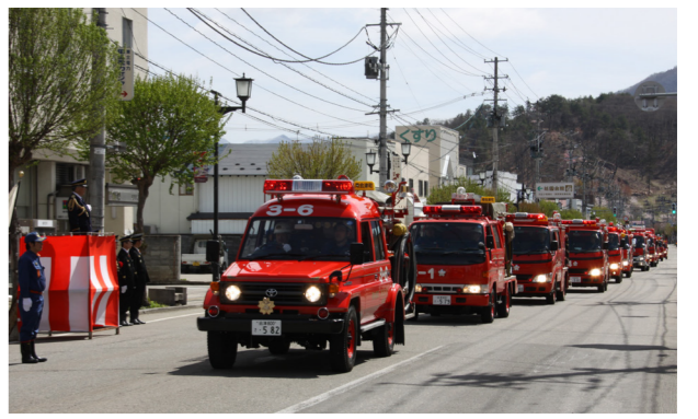
分列行進(車両部隊)