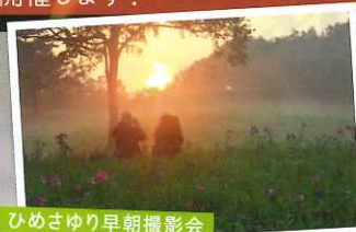
ひめさゆり早朝撮影会