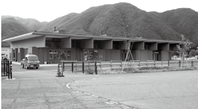
事業の拠点施設である「きとね」(宮本地区)

田島小のプールは、一般的な修繕では改修できない可能性があり、今後学校単独のプールの新設は難しいと判断し、隣接の学校や町民プールでの水泳授業を考えています。町内の学校施設は、大規模な改修を必要とする時期を迎えており、南会津町学校施設長寿命化計画を策定して維持管理していきます。