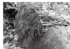
▲石の上で枯死させる