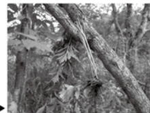
立木を利用して枯死させる▶