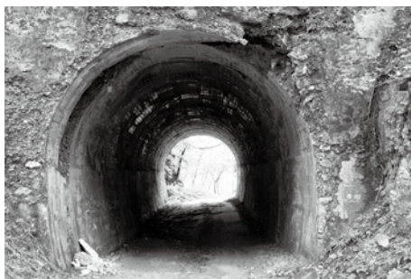
隧道の一部が崩れている