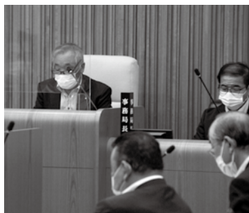
進行は議会運営委員会