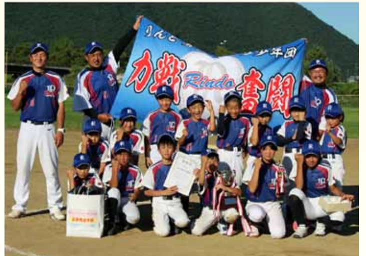
歓喜の勝利に笑顔いっぱいの選手と指導者の皆さん