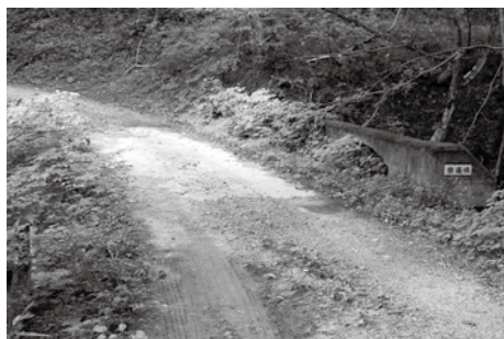
道路の幅が狭いカーブ