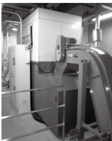
施設内部のボイラー