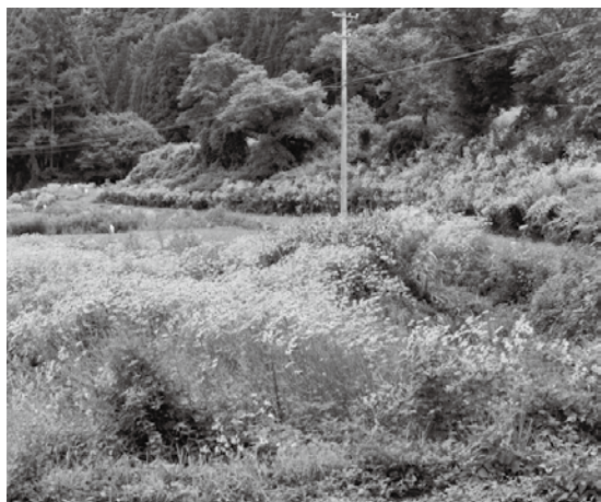
山際まで広がるオオハンゴンソウ