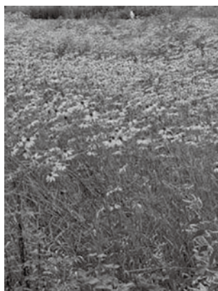
オオハンゴンソウ（荒海地区）

分布領域の拡大を防ぐ対策は年2回から3回の根元からの刈り取りや、根を残さないように抜き取るなどの方法が考えられます。今後地区や事業者と連携し、駆除対策を検討していきます。