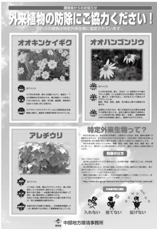
出典：環境省 中部地方環境事務所作成チラシ 「外来生物の防除にご協力ください」