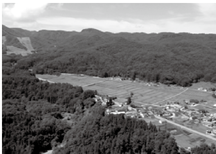
上空から針生地区をドローン撮影