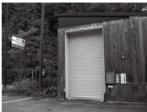
きらら 289（山口地区）の木質ボイラー施設