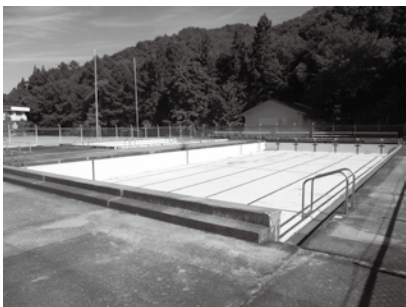
田島小学校のプール