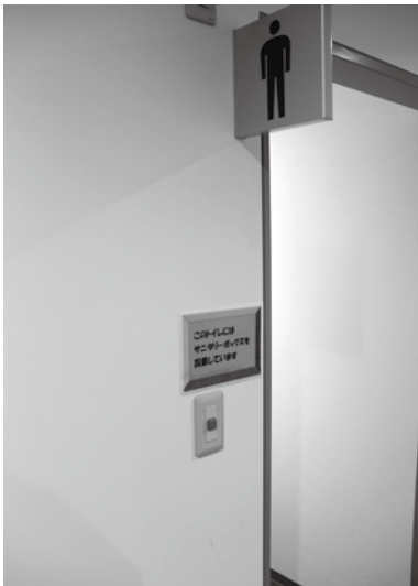
役場男性用トイレ入口掲示のサニタリーボックス設置案内

男性の方も外出時など安心して使用できる、公共施設などの男性用トイレに尿漏れパットやおむつなどを捨てられるサニタリーボックスを設置しては。