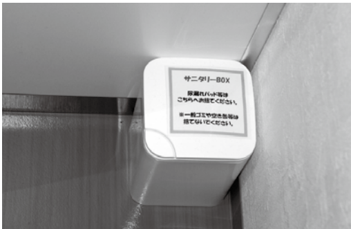
男性用トイレに設置されたサニタリーボックス