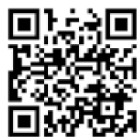
南会津町役場 YouTube チャンネル

CM大賞応募以外の作品は、南会津町役場 YouTube チャンネルで公開しています。