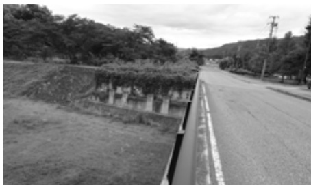
御蔵入大橋の現状

県総合計画 で、「地理 的な条件や自然環境、 歴史・文化など、それ ぞれの特性を生かし7 つの地域区分により地 域づくりが進められ、 今後も、各地方振興局 を中心に7つの地域に