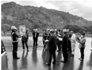
新潟県側の工事進捗状況の説明をする国土交通省職員