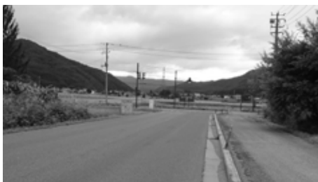
直角交差ではなく延伸を

大別し、地域づくりを 進めて行きます」と明 記されており継続され ると認識しています。 なお、将来にわたる 継続に向け、郡内4町 村と一致結束し取組を 進めます。