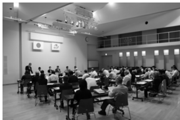
観光施設評価結果住民説明会の様子 (田島地域)