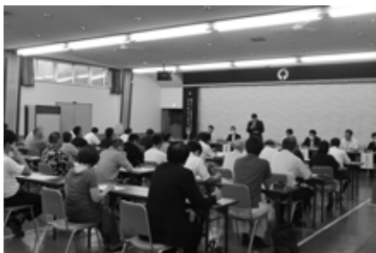
観光施設評価結果住民説明会の様子 (伊南地域)

提言内容の 実現性を見 極めながら、改善を促 し監視していく考えで す。必要に応じて、経 営方針の見直しや取締 役の交代なども求めた いと考えています。