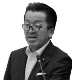
ほし かずたか 議員 星 和孝