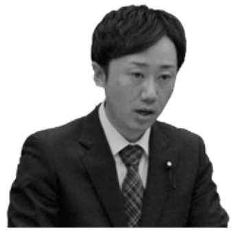
わたなべ ゆうた 議員 渡部 裕太