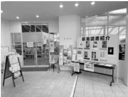
御蔵入交流館 図書館