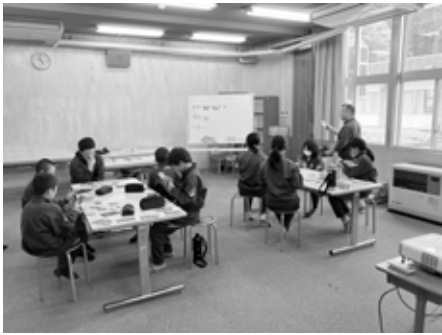
SDGs カードゲームで学ぶ児童たち

荒海中、南会津中で人財育成支援事業として「SDGsカードゲーム」とありますが、これが導入されるようになった経緯と今後の予定は。