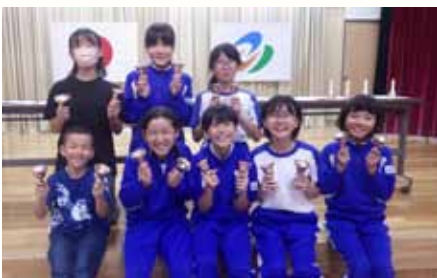
ハンドベル隊のみなさん