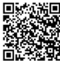
ふくしまふるさとCM大賞 2024 に作品を応募しました

これは、町が中小企業診断協会に委託した評価であり、町の方針ではありません。現段階でどのようなプロセスで進めるかは答えられません。