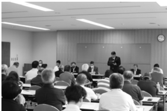
観光施設評価結果住民説明会の様子 (館岩地域)

町長 議会にも報告・相談しながら進めていくほか、地域住民や関係団体などとの話し合いを重ねながら進めるべき事項です。最終的な方針決定まで、約半年以上を要します。