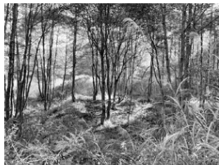
荒れた状態の休耕田

本のプレゼントの考えはありませんが、赤ちゃんとその保護者に絵本をプレゼントする「ブックスタート事業」や「2歳児への読み聞かせ事業」、小学校では、朝の「読書タイム」や図書ボランティアによる「読み聞かせ」、中学校では「ビデオバトル」などを