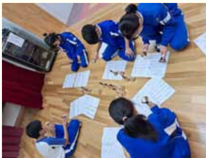
楽譜でしっかり確認

私たち6年生は、抜けてしましますが、次に続く人達にもハンドベルの楽しさや、上手くいったときの感動を味わってもらいたいで絶対私達の後に続いて欲しいです。