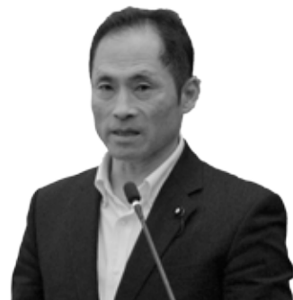
ふるかわ あきら 議員 古川 晃