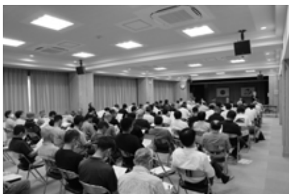
観光施設評価結果住民説明会の様子 (南郷地域)