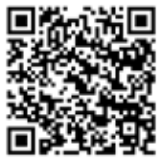
路線バス再編について

檜枝岐線の経路変更による影響としては、これまで路線バスを利用して、館岩地域の内外へ移動していた方々の利便性の低下や、会津高原尾瀬口駅の利用者の減少により、「会津高原憩の家」の売り上げの減少が想定されます。