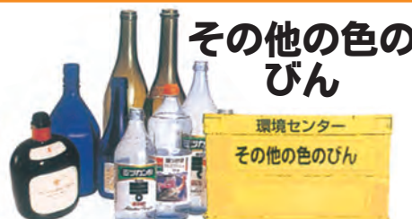
その他の色のびん