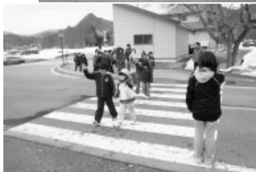
4/10 上郷小学校 交通安全教室