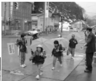
4/20 南郷第一小学校 交通安全教室 ▶