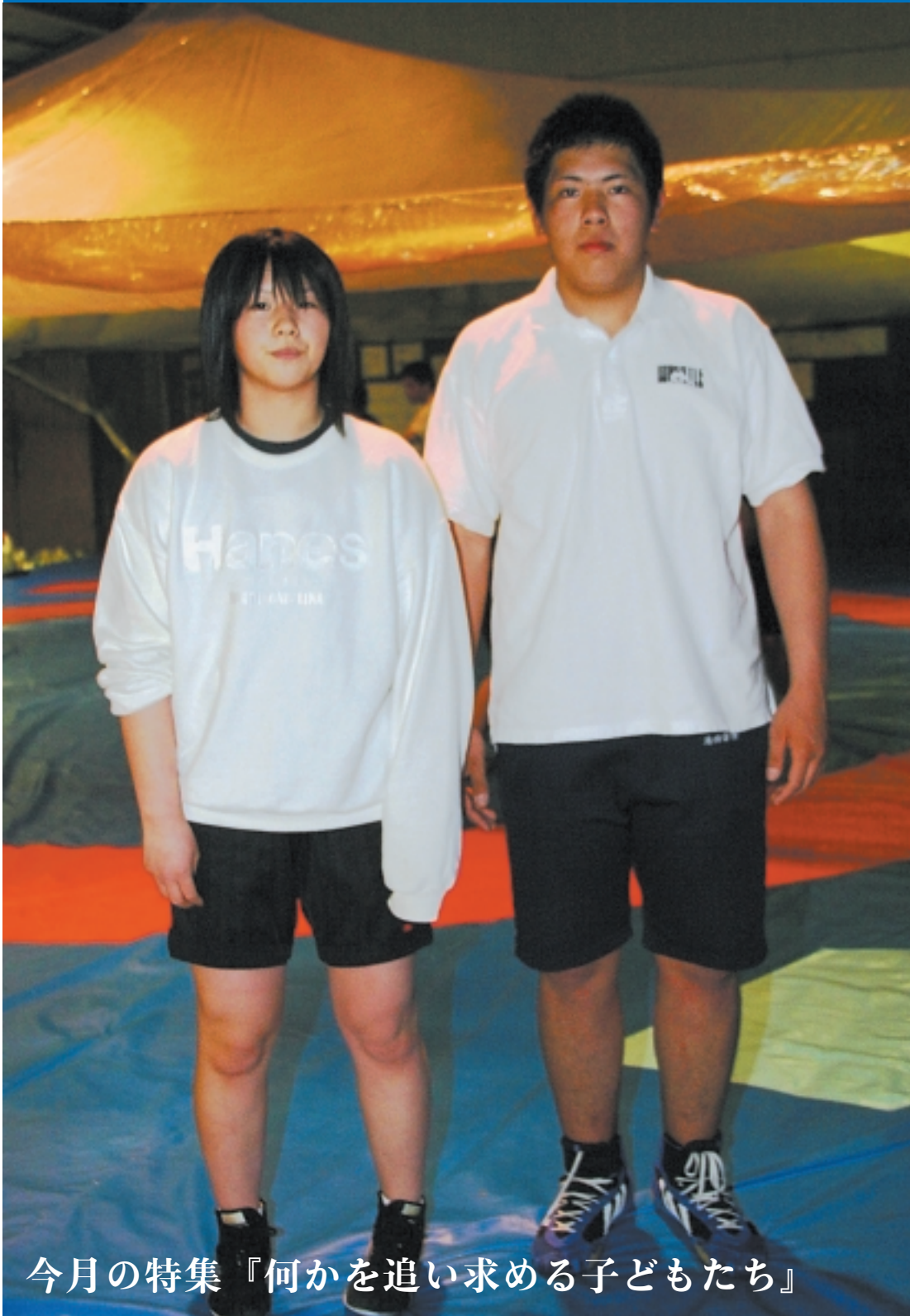
今月の特集『何かを追い求める子どもたち』