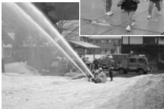
4/15 伊南地域 非常召集訓練