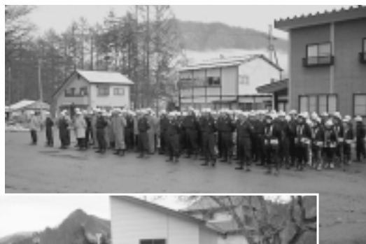
▶ 4 / 15 田島地域 非常召集訓練