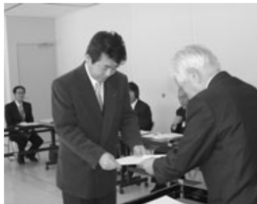
任命書が交付された教育委員会臨時会