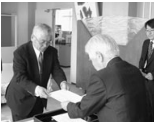
農業委員会任命式では、新しい農業委員に任命書が手渡されました