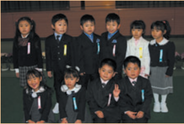
田島小では5組の双子ちゃんたちが入学しました

南会津町となつて最初の入学式となつた今年は、田島地区104人・館岩地区22人・伊南11人・南郷地区25人の合わせて162人が大きな希望を胸に学び舎の門をくぐりました。