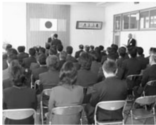
係長職以上の職員に対する辞令交付

新生・南会津町のスタートとなった3月20日には、各種窓口業務がスタートしたほか、教育委員や消防団長、農業委員などに対する任命書交付式も行われました。