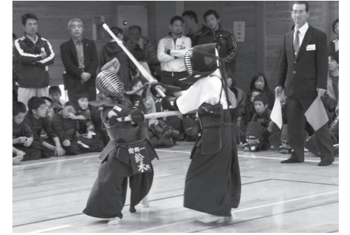
熱戦を繰り広げる少年剣士

10月1日と2日の2日間にわたり、『第32回南会津町伊南武道館少年剣道大会』が、伊南地域交流センターと伊南武道館で行われ、県内外の少年剣士延べ965名が団体戦と個人戦で優勝目指して熱戦を繰り広げました。東日本大震災で甚大な被害を受け、原発事故により避難を余儀なくされている相双地区からも多くのチームが参加し、元気いっぱい試合に臨みました。小学女子団体が優勝した富岡町少年剣道団のメンバーは、現在、県内外にばらばらに避難しており、優勝もさることながら、久々に同じチームで戦えたことがとてもうれしかったそうです。