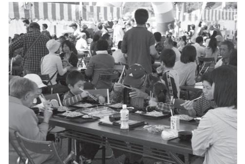
打ちたてのそばを堪能する来場者

南会津そば振興協議会主催の『第3回南会津新そばまつり』が、10月9日と10日の両日、御蔵入交流館の駐車場で開催され、町内のそば愛好会のほか、南会津郡内外から8店舗の出店があり、来場者はそれぞれ特色のあるそばを楽しみました。2日間とも天候にも恵まれ、県内外から多くのそばファンが訪れ、打ちたてのそばに舌鼓を打ちました。今年は、昨年を大きく上回る約8,000食のそばが、2日間で提供されました。