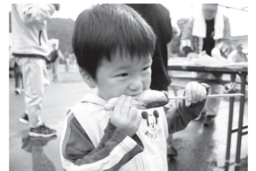
鮎の塩焼きにかぶりつく子ども

10月16日、古町温泉赤岩荘周辺の特設会場で、『伊南川古町温泉あゆまつり』が開催され、鮎の塩焼きやまいたけとキビの入ったふかしご飯などの『鮎定食』のほか、手打ちそばや山菜おこわなど、来場者は南会津の秋の味覚を堪能しました。7月の記録的な豪雨の影響で、関係者は鮎の確保に苦慮されましたが、伊南川の鮎を目当てに来るお客さんのために、例年よりは少ないものの何とか500匹の鮎を準備。買い求めたお客さんが、会場のあちらこちらでおいしそうに鮎の塩焼きをほおぼっていました。