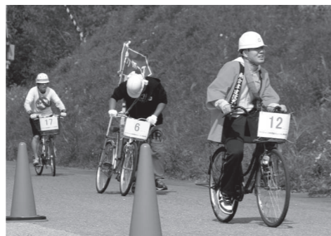
最後ののぼり坂を進む参加者

10月1日、たかつえスキー場スキーセンタースペースア前をスタートゴールとする1周約5.6キロの特設会場で、『ママチャリ5時間耐久レースin南会津』が開催され、県内外からエントリーした17チームの選手が、大自然の中でのレースを楽しみました。この大会は、1台の自転車で交代しながら5時間走り続け、トータルの周回数を競うもので、通常この種の大会は、サーキット場のようなあまり高低差のないところで行われますが、今回のコースは起伏の激しいコースで、参加者は全力で難コースに挑んでいました。