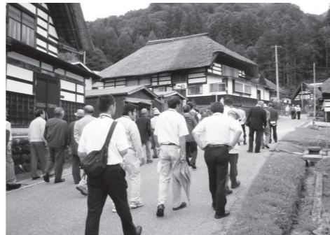
前沢集落を見学する研修会参加者

9月21～22日、福島県文化財保護指導者研修会が南会津町で開催され、県内の文化財保護審議会委員や自治体職員らが文化財の保護や活用について見識を深めました。初日の基調講演や事例報告に続き、2日目は県指定史跡の久川城、奥会津博物館、今年6月に国の伝統的建造物群保存地区に選定された前沢曲家集落の現地視察が行われました。前沢曲家集落の現地研修では、前沢集落の住民の方々の説明を受けながら前沢曲家資料館などを見学したほか、前沢集落の歴史や曲家の構造の特徴など学んでいました。