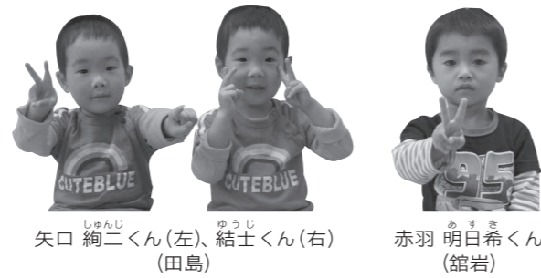
矢口 紇二くん(左)、結土くん(右) (田島) 赤羽 明日希くん (館岩)