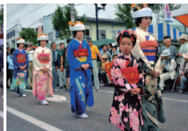
佳作「会津田島の秀麗な花嫁行列」 阿蘇 周重(福島市)