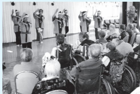
伊南ホーム慰問の際の1コマ