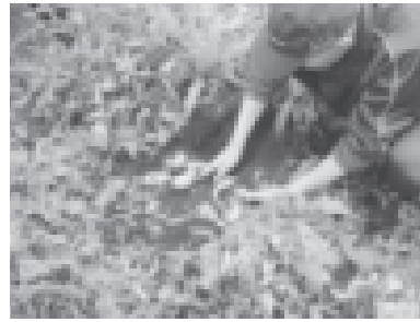
かぎりなく無農薬で栽培された農作物