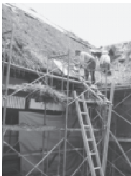
かやぶき屋根葺き替え作業のようす

古民家を2地域居住の促進と体験型宿泊施設や、ゲストハウスとして再生するモデル事業を実施しています。