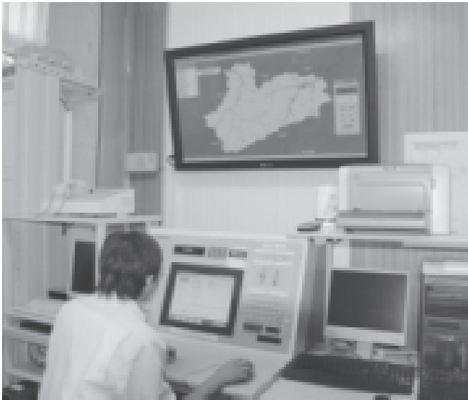
防災行政無線を通じて情報を発信する職員

館岩、伊南、南郷支団では、毎月1日、15日に夜警を実施し、地区毎に火の用心の見回りを行っています。田島地域では、毎月15日を「防火の日」と定めていますが、地域の自主防災活動や防災無線による火の用心の呼びかけに配慮します。