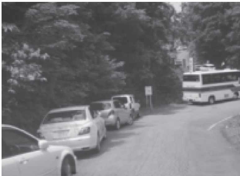
駐車場満車によって引き起こる路上駐車