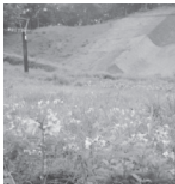
ひめさゆりが咲き誇る南郷スキー場