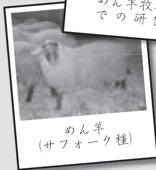
めん羊 (サフォーク種)