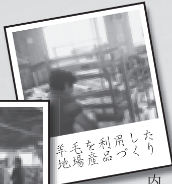
羊毛を地場産品として活用したり

当町にも町有林の中に伐採期に達した人工林があり、計画的に事業展開すれば、林業従事者の増加や雇用促進だけでなく、二酸化炭素削減の効果も期待できると考えます。