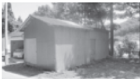
現在の上屋台格納倉庫

商工観光課長 西屋台展示車庫施設の取得地は2筆で面積は643・85㎡です。一方、上屋台展示車庫施設の取得地は2筆で730・50㎡です。土地の評価は不動産鑑定士を入れて契約します。 地区との話し合いの状況は、町では地域と屋台運営協議会は連動