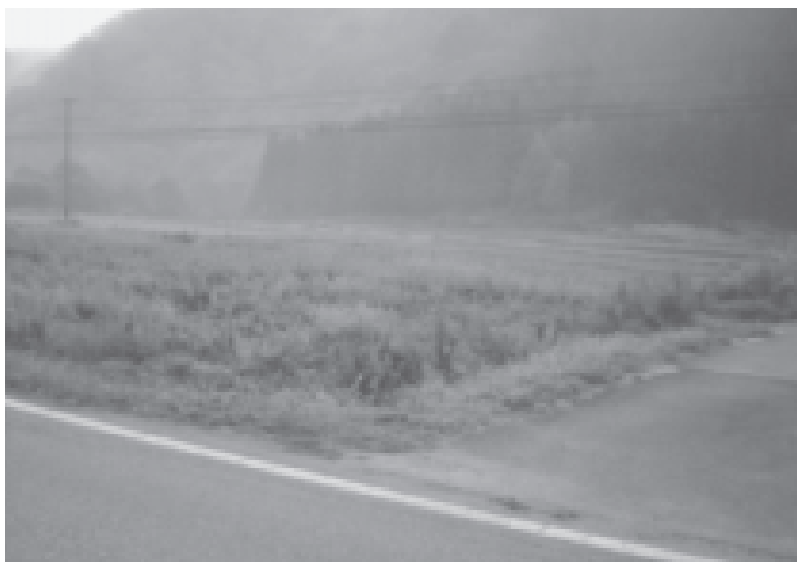
雑草が密生する耕作放棄地

地所有者や集落住民さらには各種団体との協議を進めます。町内の第3セクターや地元企業の農業への参入を促進し、集落維持発展支援事業など町独自の支援をしていきます。