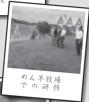
めん羊牧場での研修