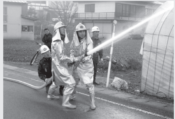
本番さながらに行われた訓練