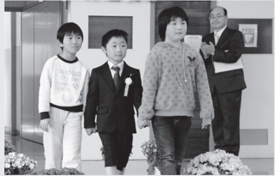
上級生に手を引かれながら入場する新一年生 (南郷第1小学校)

校長先生からひとりひとり名前を呼ばれると、大きな声で「ハイッ」と返事をし、元気よく起立する姿や校長先生のお話をしっかりと聞いている姿は、すっかりおにいちゃん、おねえちゃんになっていました。