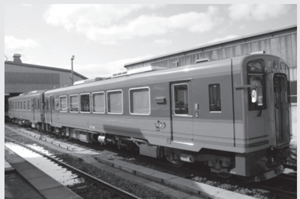
設備も充実した新型マウントエクスプレス