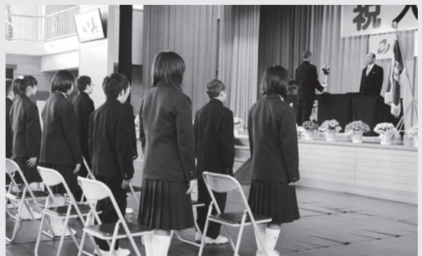
新入生代表あいさつの様子 (荒海中学校)

中学校時代は将来に大きく影響する大切な時期です。よく学び、よく遊び、そしてよく運動して、強くたくましく育ってほしいものです。