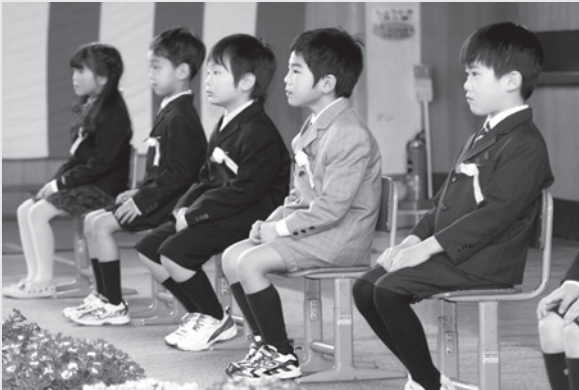
校長先生のお話を聞く新一年生 (伊南小学校)

式では、緊張した面持ちで入場した子どもたちでしたが、式が進むにつれ次第に穏やかな表情になり、いつもの笑顔があちこちで見られました。