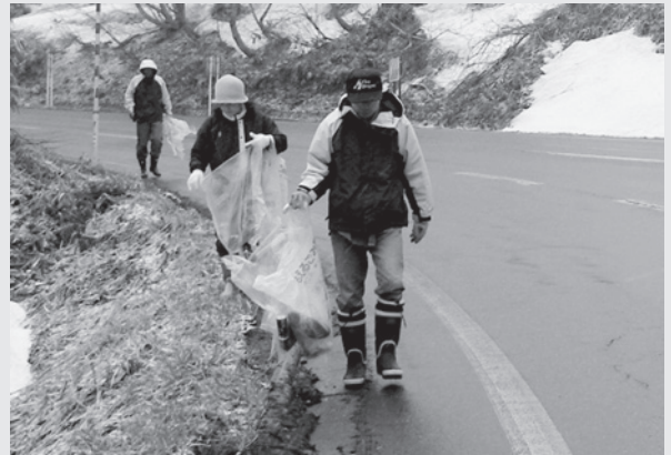
おもてなしの心で清掃活動を行う地区住民