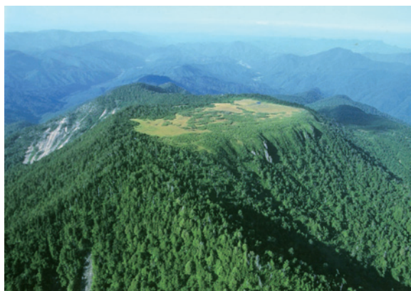
尾瀬国立公園田代山の山頂