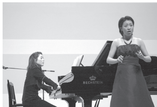
2010年1月に行われた「ニューイヤーコンサート」

寄付に関するお問い合わせは生涯学習課（0241-62-6311）までお願いします。