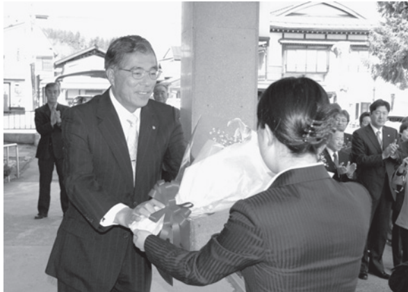
初登庁で職員から花束を贈られる大宅町長

南会津地方の中核である南会津町の長として町をしっかりとまとめ、町民の方々が自信と誇りを持って暮らしていけるような町づくりをしていきたいと思えますので、ご協力よろしく願っています。