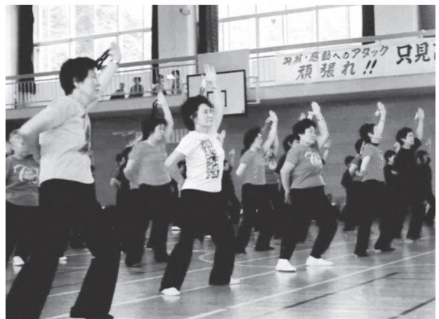
3B体操の講習会風景