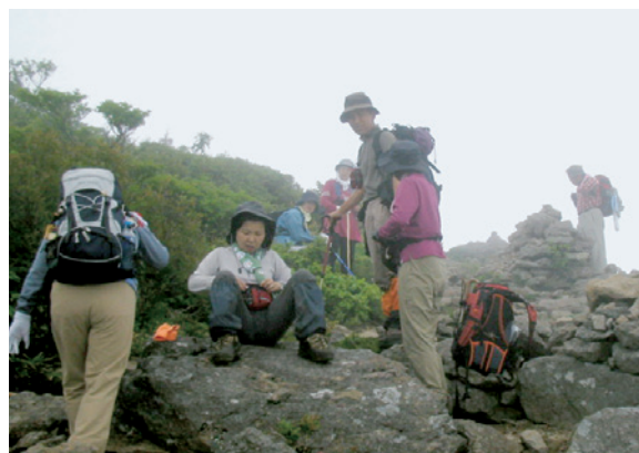
昨年の七ヶ岳山開き山頂の様子