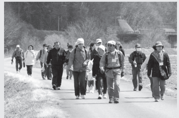
それぞれのペースでゴールを目指す参加者