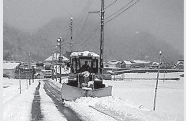
この時期にはめずらしく除雪車が出動