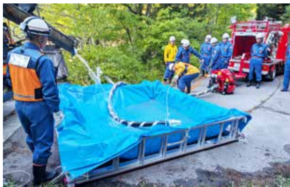
コンクリートミキサー車を利用した長距離放水訓練(趾風区)