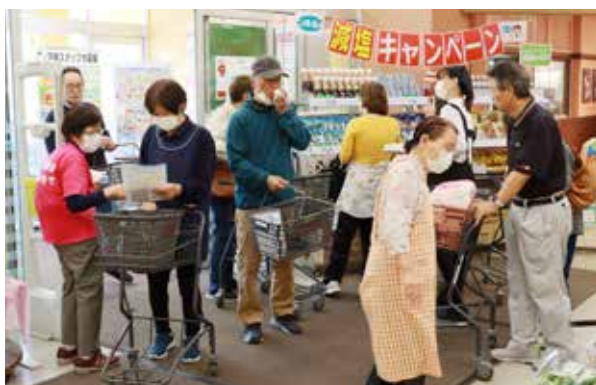
店頭イベントの様子