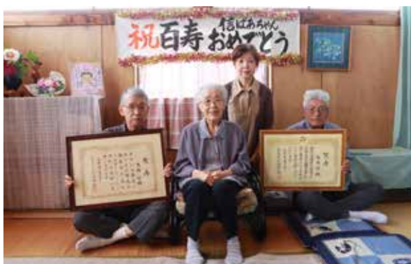
ご家族と一緒に撮影に応じる信さん㊤