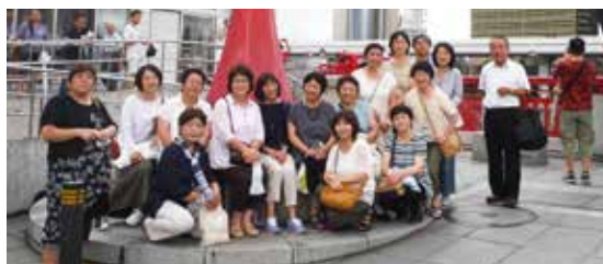
30周年特別企画として1泊2日で行われた「台東区夏ツアー」