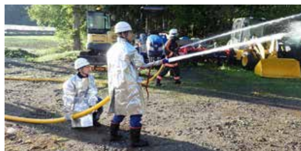
舘岩分遣所と連携した消火活動(福渡区)