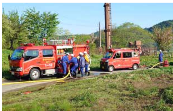
動作を確認しながら訓練に臨む(和泉田区)

町消防団では、引き続き予防消防の啓発強化に努めてまいりますので、地域の皆さまのご理解とご協力をお願いします。