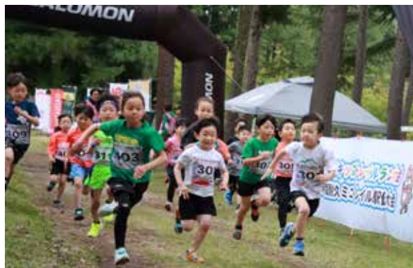
勢いよくスタートを切る選手たち

県内外の未就学児から一般の方まで約230名が参加し、同校が保有する広大な演習林を舞台に力走を見せました。