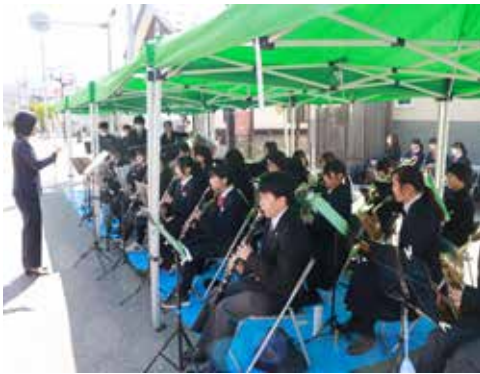
田島中学校・南会津高校の吹奏楽部の皆さん