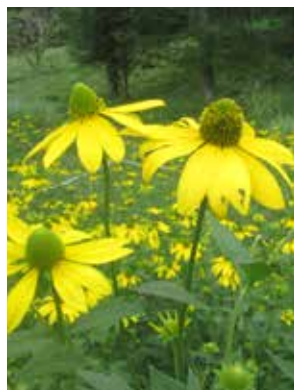
オオハンゴンソウ