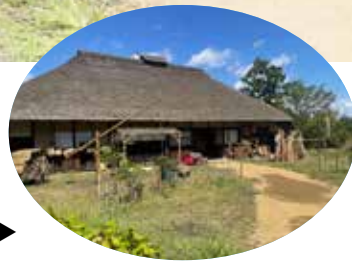
ロケ地となった染屋▶