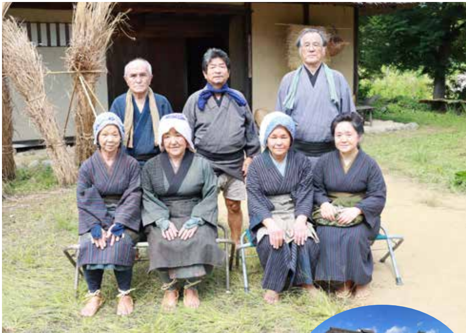
▲エキストラとして参加した皆さん