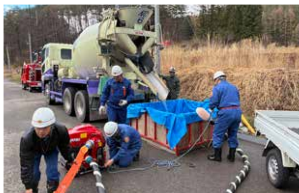
コンクリートミキサー車を利用した長距離放水訓練(羽塩区)