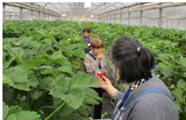
いちご狩りの様子

移動中の懇談や昼食、買い物、いちご狩りなどを通じて参加者同士の交流を深め、参加された皆さんにとって心身のリフレッシュを図る有意義な1日となりました。