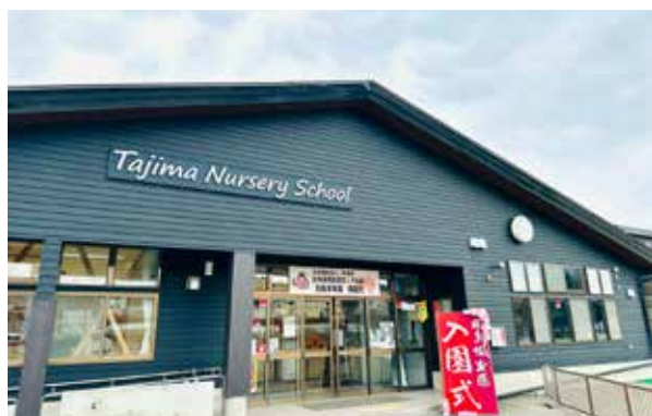
幼保連携型認定こども園として生まれ変わった園舎