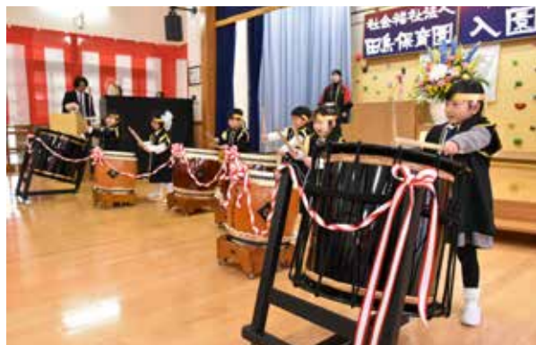
太鼓を演奏して開園をお祝い