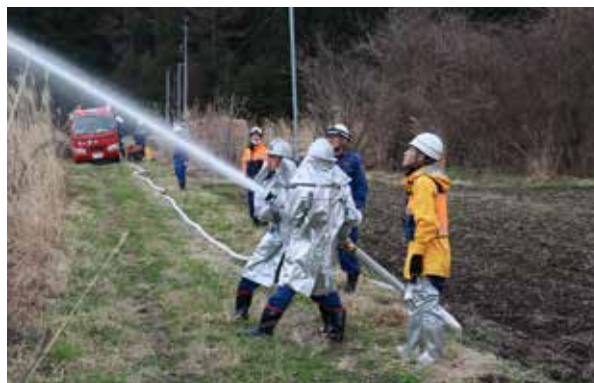
本番さながらの迅速な消火訓練(田部区)

空気が乾燥し、火災が発生しやすい季節になりましたので、火の取り扱いには十分注意し、火災予防の徹底をお願いします。