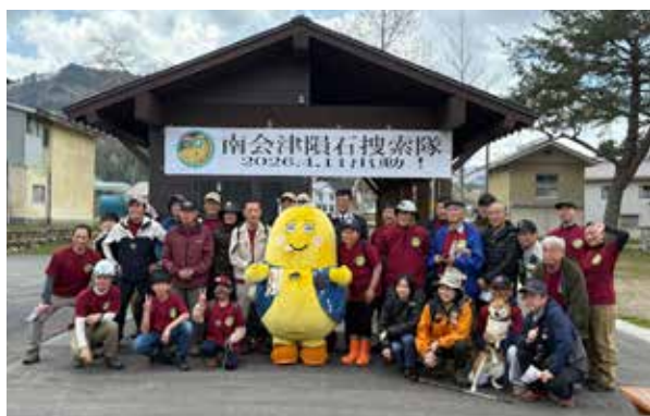
搜索活動に参加した皆さん