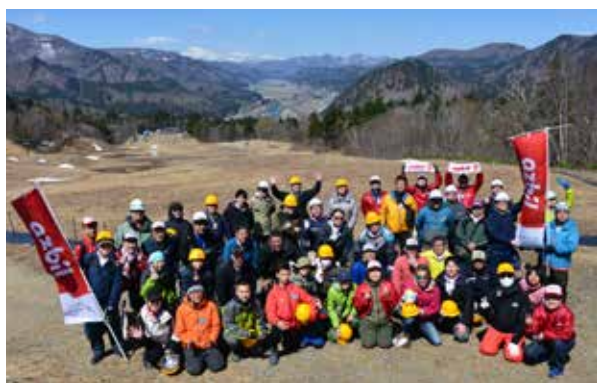
保全活動に参加した皆さん