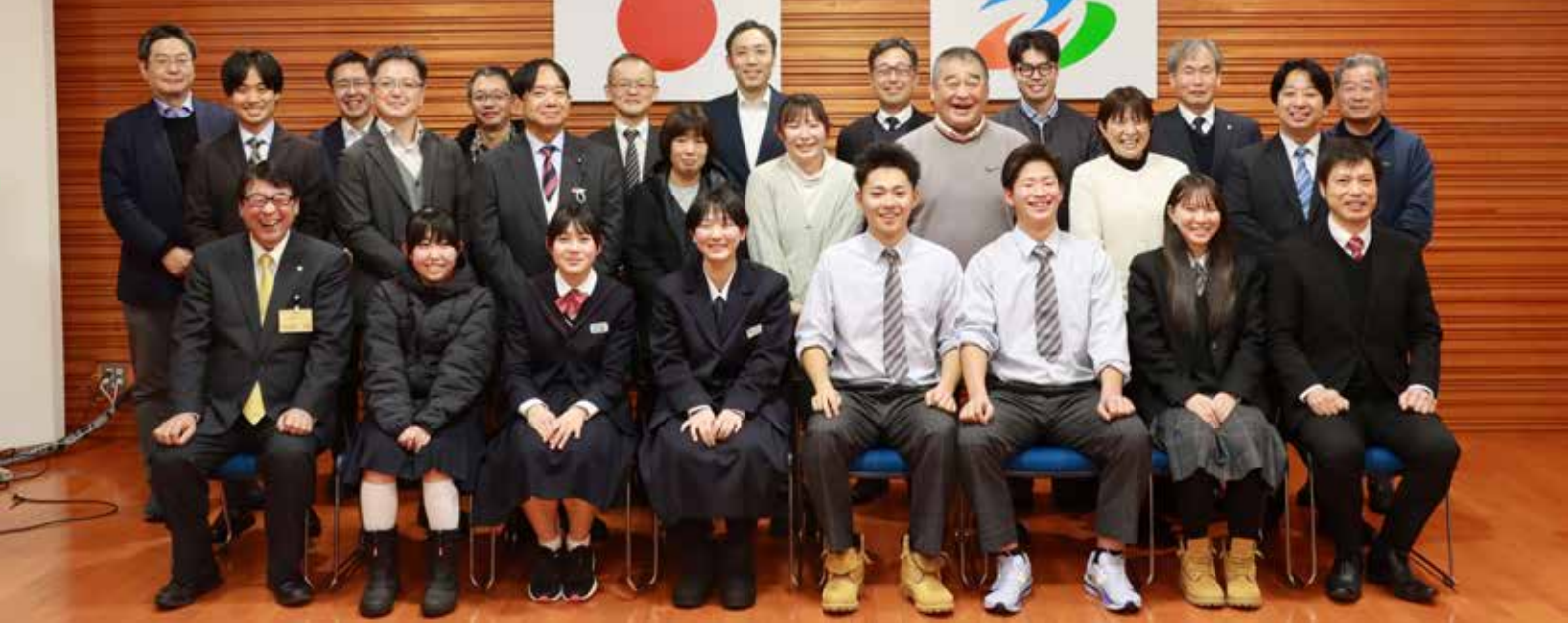
ワークショップに参加した皆さん