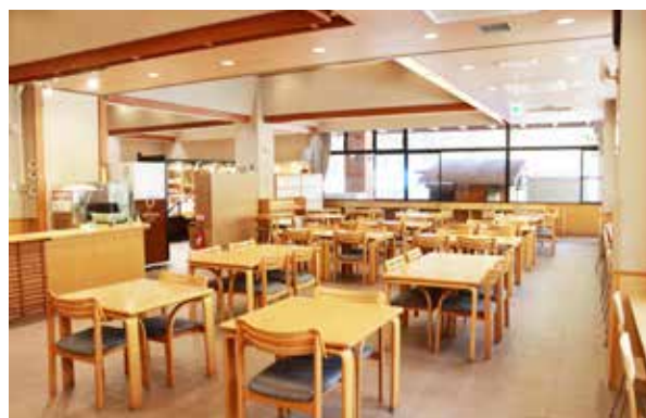
リニューアルした館内(レストラン)