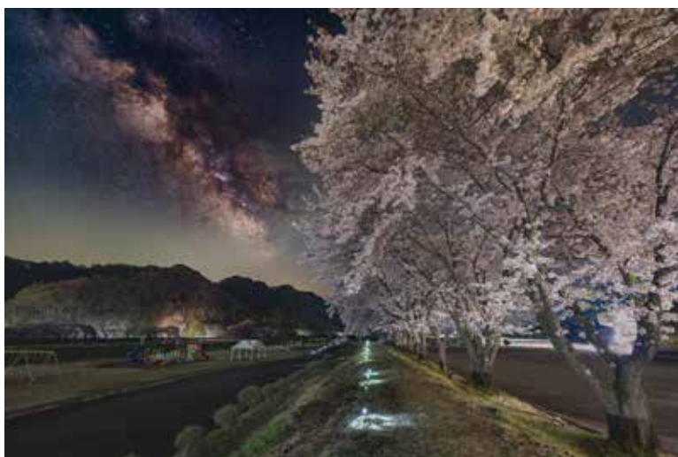
グランプリ作品「星と花と遊び場と」