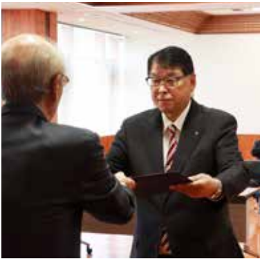
4月21日当選証書附与式