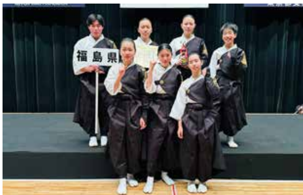
会津田島太鼓ジュニアの皆さん