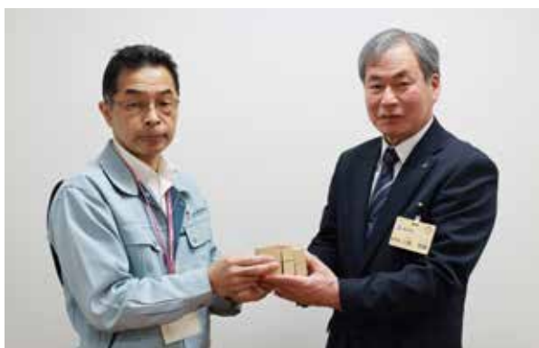
ゴム印を手渡す渡部支店長㊦