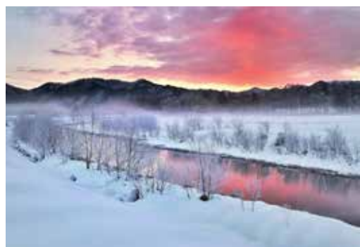
準グランプリ作品「厳寒を彩る」