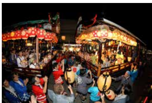
準グランプリ作品 「オーンサンヤレカケロ」