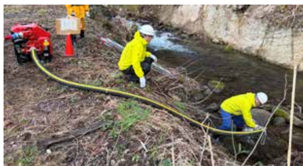
河川を水利と想定した訓練(高野区)