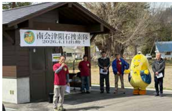
キックオフイベントの様子

今回は残念ながら発見には至りませんでした。参加者の意欲は高く、今後の活動に期待が膨らむ1日となりました。