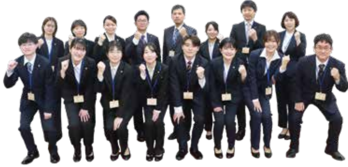
令和8年度新規採用職員

令和9年4月1日採用町職員採用候補者試験の募集を開始しました。受験を希望される方は、期限内にお手続きください。