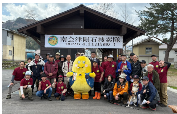
搜索活動に参加した皆さん

今回は残念ながら発見には至りませんでしたが、参加者の意欲は高く、今後の活動に期待が膨らむ1日となりました。