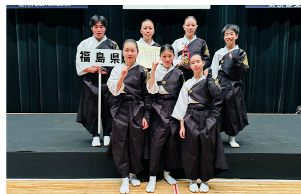
会津田島太鼓ジュニアの皆さん