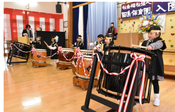
太鼓を演奏して開園をお祝い