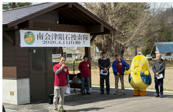
キックオフイベントの様子

今回の電気柵設置作業には51名が参加し、そのうち23名が南会津町ふるさとサポーターに登録されています。