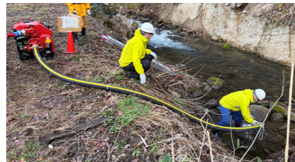
河川を水利と想定した訓練(高野区)

空気が乾燥し、火災が発生しやすい季節になりました ので、火の取り扱いには十分注意し、火災予防の徹底 をお願いします。