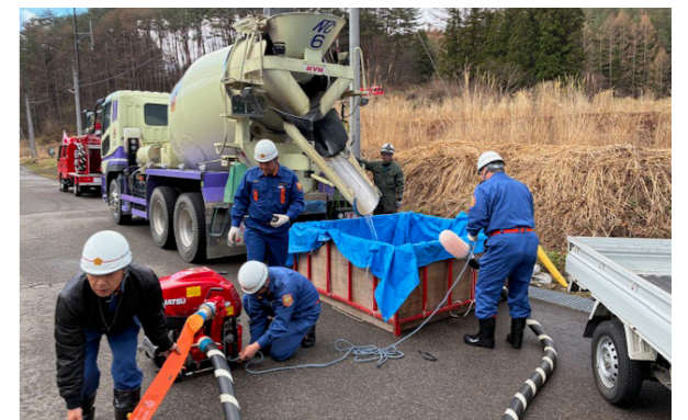
コンクリートミキサー車を利用した長距離放水訓練(羽塩区)