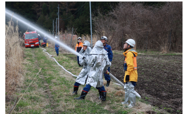
本番さながらの迅速な消火訓練(田部区)