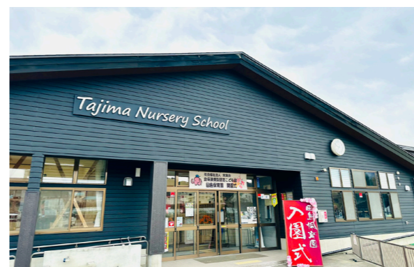
幼保連携型認定子ども園として生まれ変わった園舎