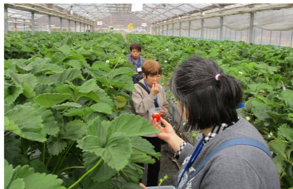
いちご狩りの様子

移動中の懇談や昼食、買い物、いちご狩りなどを通じて参加者同士の交流を深め、参加された皆さんにとって心身のリフレッシュを図る有意義な1日となりました。