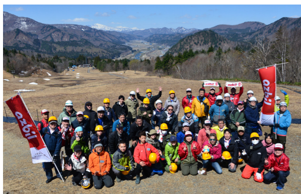
保全活動に参加した皆さん