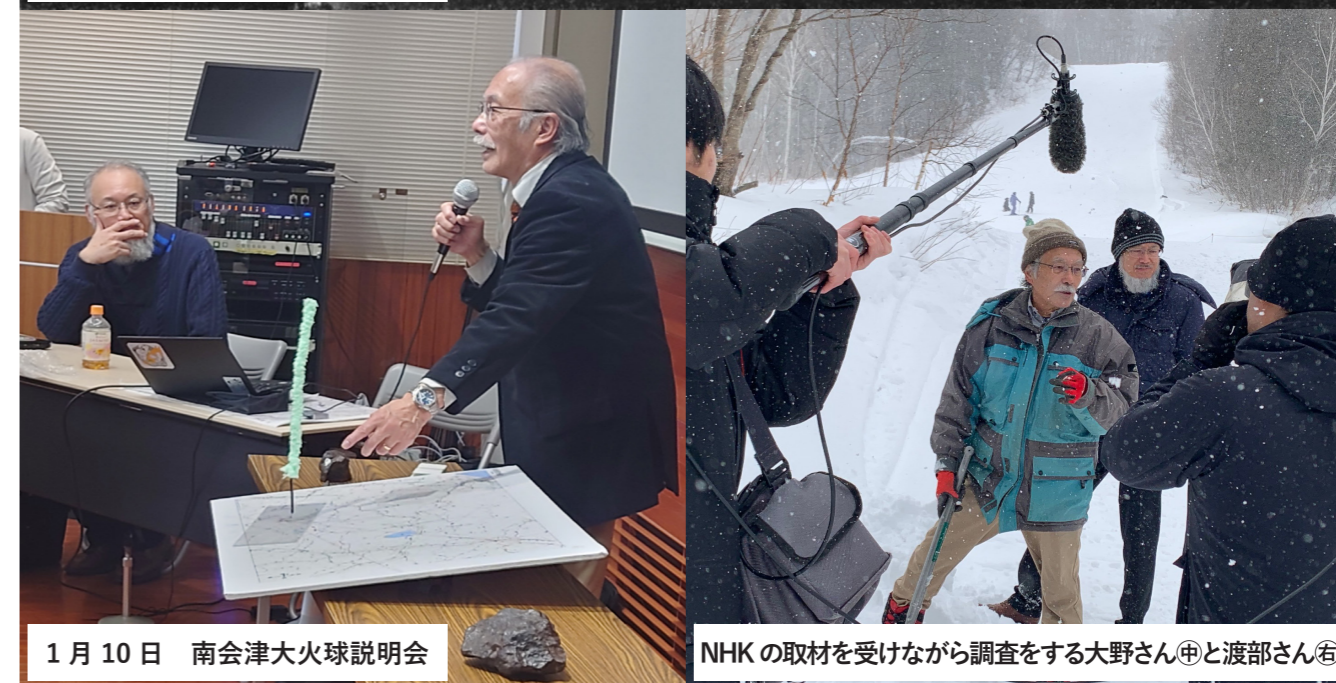
1月10日 南会津大火球説明会