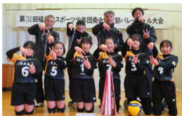
優勝した荒海スポーツ少年団の皆さん