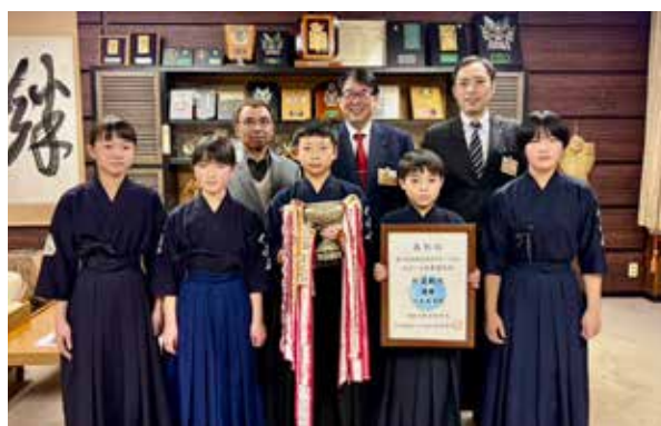
伊南武道館の皆さん