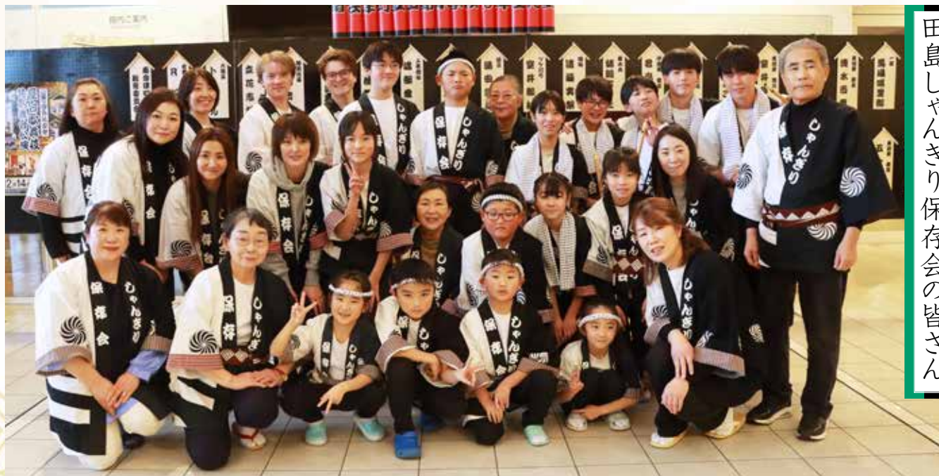
田島しゃんぎり保存会の皆さん