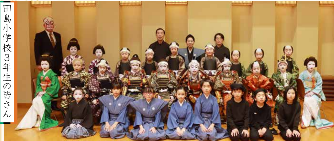
田島小学校3年生の皆さん