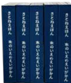
▲完成した木の絵本