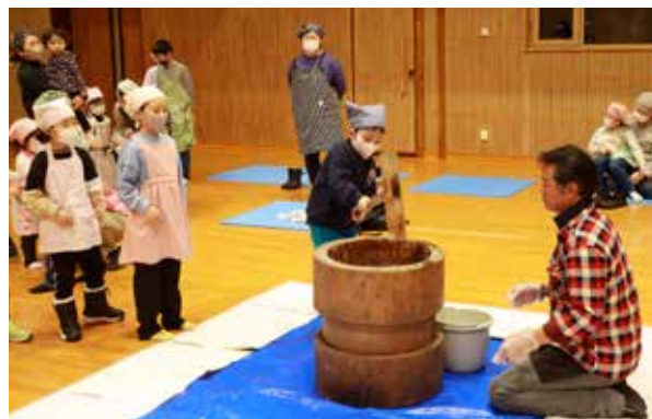
杵と臼を使って餅つき

ついた餅は、その場であんこ餅やきなこ餅などに仕上げ、つきたてならではの美味しさを味わいました。