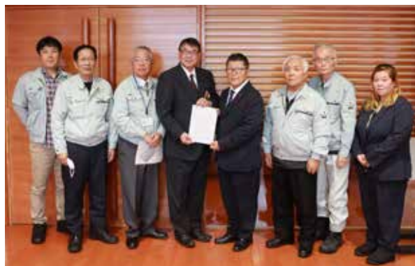
意見書を渡部町長へ手渡す委員の方々

12月16日、南会津町農業委員会は、渡部町長に「農地利用の最適化の推進に関する意見書」を手渡し、農地・農業政策の現状や課題について意見交換を行いました。この意見書は、担い手の農地利用の集積・集団化や、遊休農地の発生防止・解消、担い手の育成と新規就農者の支援などについて委員会の考えを取りまとめたもので、農業者の声を町政へ届けるものです。