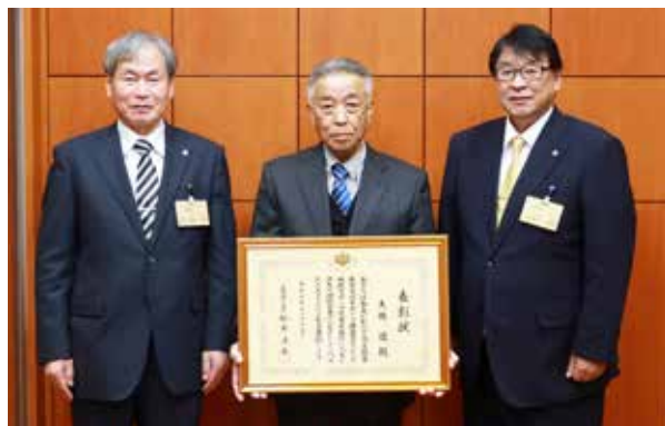
受賞報告に訪れた大橋さん㊦