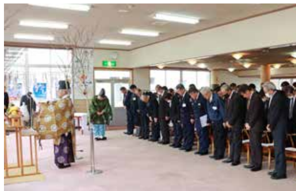
3スキー場合同安全祈願祭