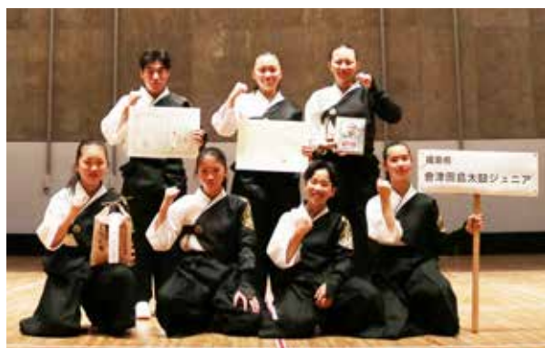
会津田島太鼓ジュニアの皆さん