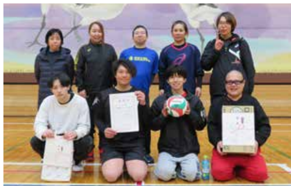
優勝した舘岩バレーボール協会の皆さん

南会津郡内から6チームが参加し、ネットを挟んで白熱した試合が繰り広げられました。