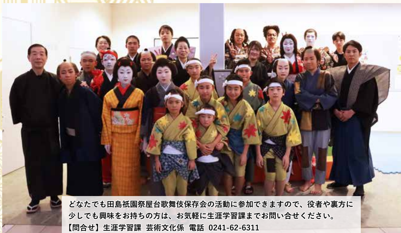
田島祇園祭屋台歌舞伎保存会の皆さん

どなたでも田島祇園祭屋台歌舞伎保存会の活動に参加できますので、役者や裏方に 少しでも興味をお持ちの方は、お気軽に生涯学習課までお問い合わせください。 【問合せ】生涯学習課 芸術文化係 電話 0241-62-6311