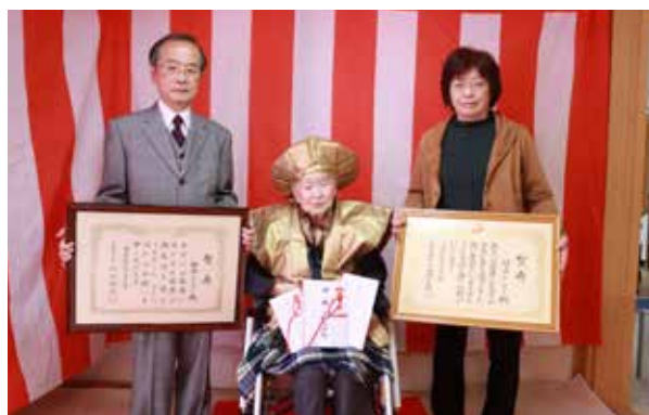
ご家族と一緒に写真撮影に応じるトシノさん㊤