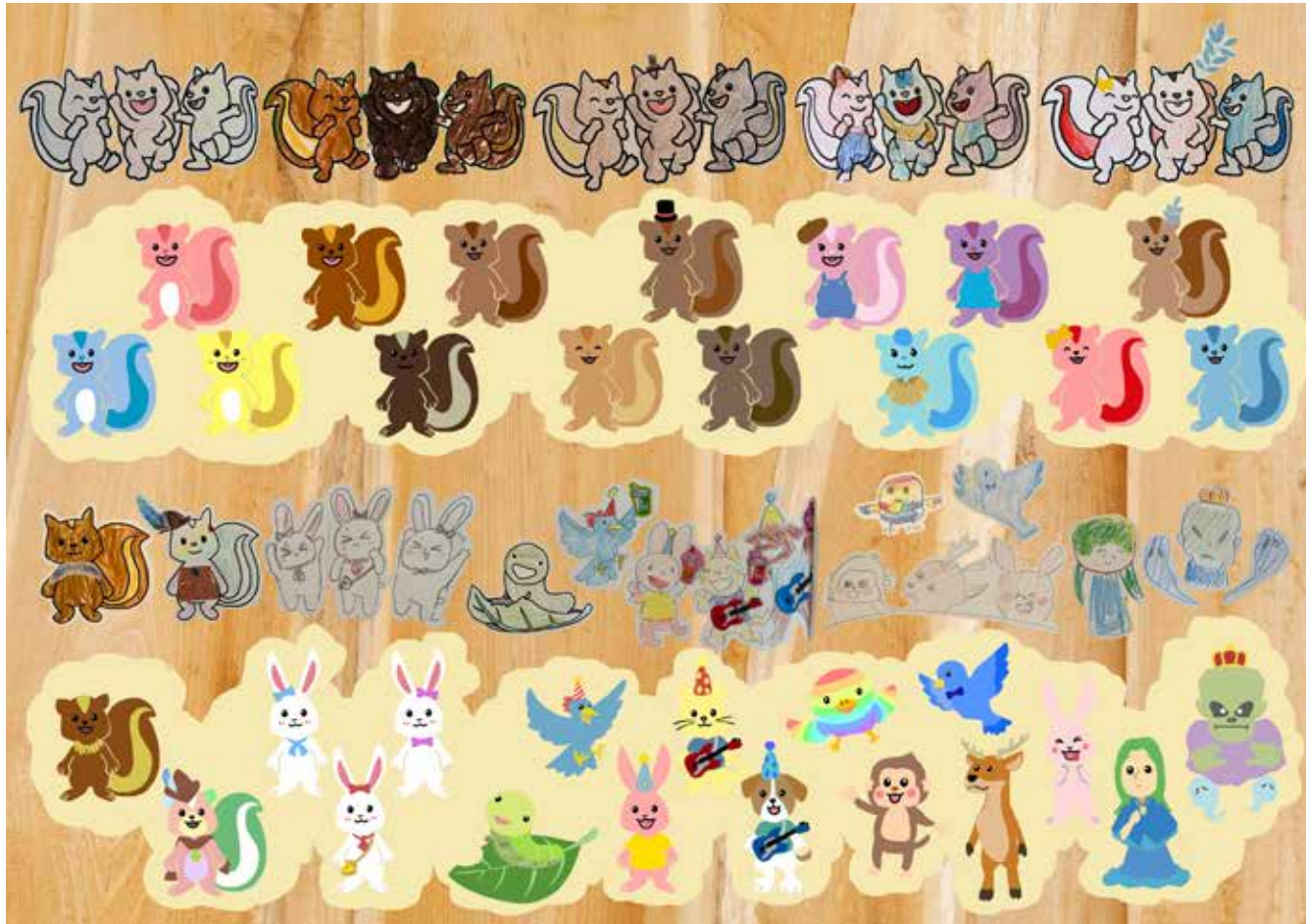
▼子どもたちがデザインしたキャラクターが絵本に登場しています！

5月10日にきとねで開催された「絵本作家さんをつくる木の絵本」において、福島県出身の絵本作家にしぎからいと先生と町内の小学生7人が作り上げた木の絵本が完成しました！ 木の絵本は、きとねや図書館、友好都市等の公共施設に配架される予定です。 シリーズ2作目となる「きとねえほん 木のいえのえいがかん」は、お散歩中のリスたちが見つけた1枚のとびらを開けるとところから物語が始まります。子どもたちが描いた個性豊かなキャラクターたちが絵本に登場します。 ぜひお手にとってご覧ください。