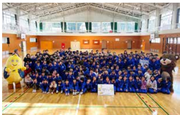
贈呈式後の集合写真