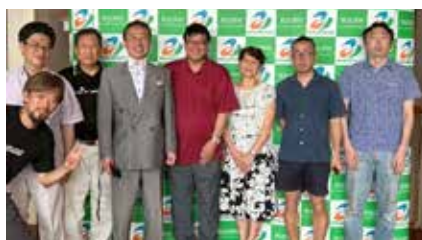
令和7年7月にふるさと納税のために来庁された役員の方々

会員の方には、会員証を発行します。会員証を提示すると、町内の協賛施設で利用料金割引等のサービスを受けることができます。