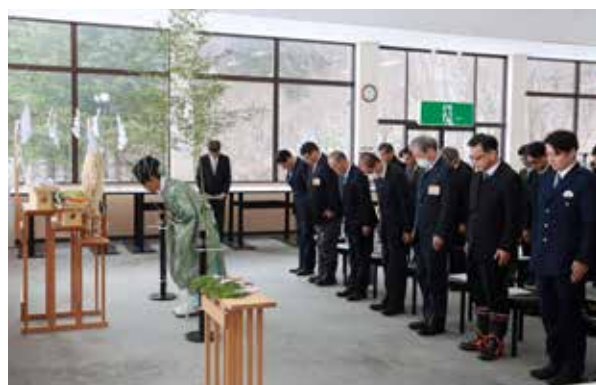
高畑スキー場安全祈願祭