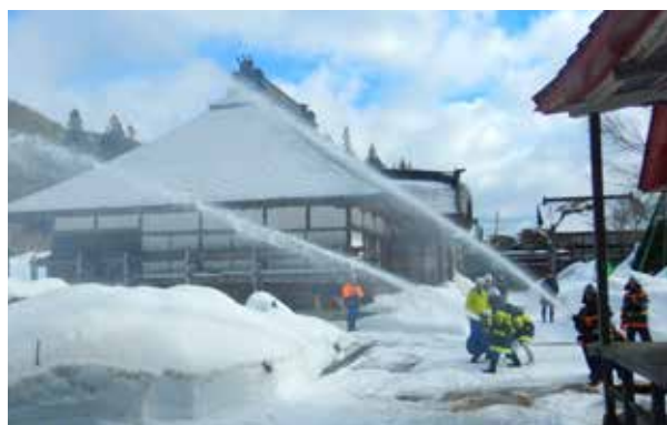
常楽院（福米沢）での訓練の様子