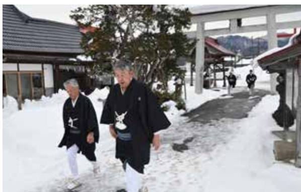
社殿まで何度も往復し祈りを捧げる