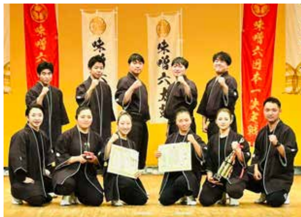
優勝した白鼓の皆さん