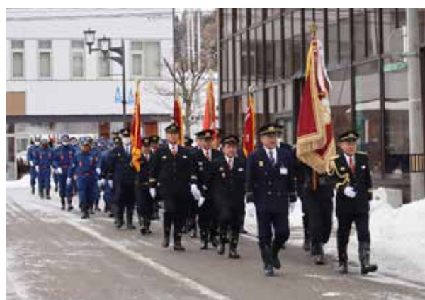
消防団員や消防車両による行進