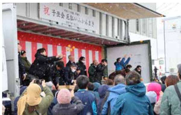
雪が降りしきる中、会場は多くの人で大賑わい