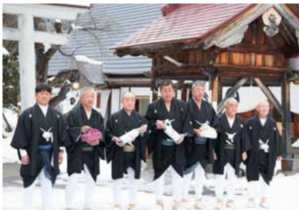
神供と神酒を手ねり歩く男衆