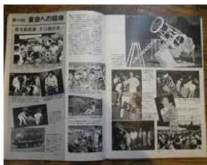
写真の記事は、天文ガイド1984年10月号より

※光害とは：過剰な光により、夜空が明るくなり、天体観測の妨げになったり、動植物の生育に悪影響をおよぼすこと。公害と混同されやすいので近年は「ひかりがい」ともいわれる。