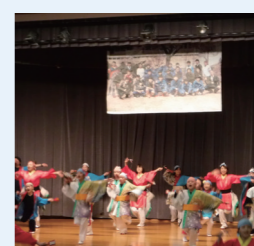
館岩地域文化祭（ステージイベント）