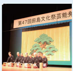
田島地域文化祭（芸能発表）

【問合せ】 生涯学習課 生涯学習係 電話 0241-62-5511 教育委員会分室 電話 0241-76-7719