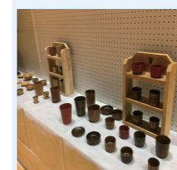
南郷地域文化祭（作品展示）

町内各地域にて、文化祭を開催します。 さまざまな文化団体の作品や体験活動に触れてみませんか。小学校作品展や高齢者作品展も同時開催されます。その他、イベントや模擬店もありますので、皆さまのご来場をお待ちしています。