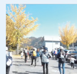
伊南地域文化の祭典（歩こうかい）