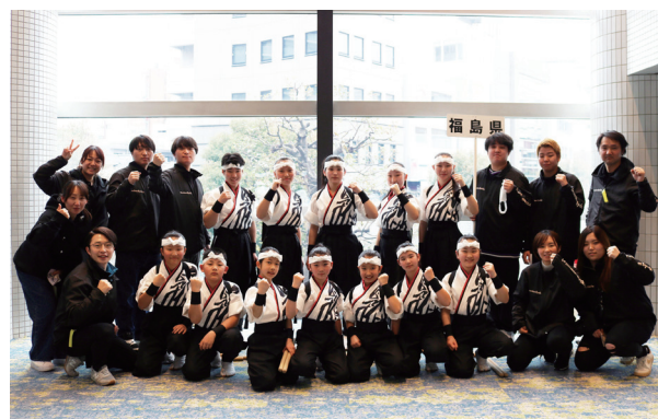
會津田島太鼓の皆さん