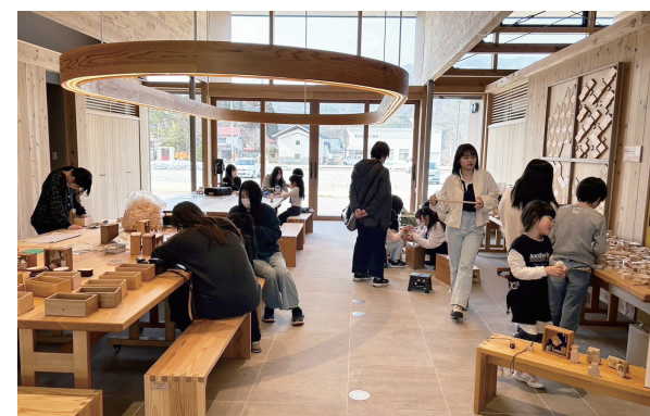
端材ワークショップの様子