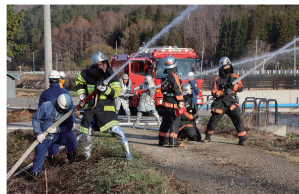
広域消防と連携しての放水活動(大豆渡区)