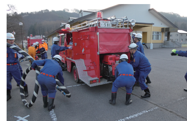
スピード感を持って訓練に取り組む(関本区)