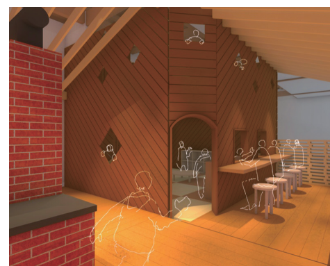
▲子どもだけが入れられる秘密基地も