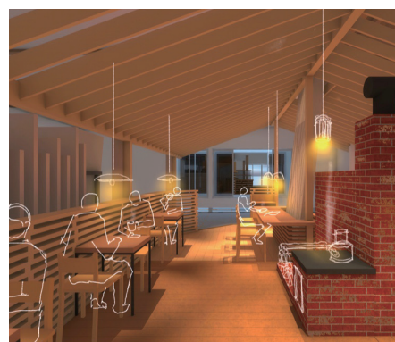
▲イートインスペース