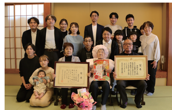
ピンクのちゃんちゃんこに身を包むヲトヨさん④