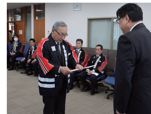
渡部町長より辞令をうける児山団長