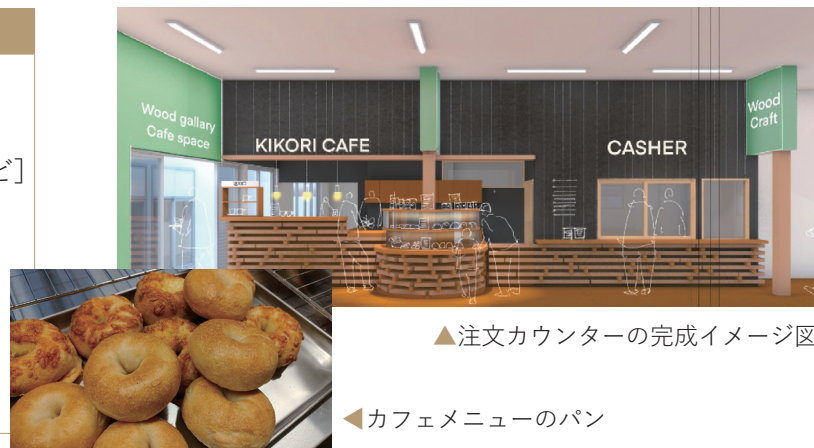
▲注文カウンターの完成イメージ図