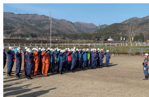
早朝より訓練に参加した団員の皆さん(永田区)

訓練は、地域住民の生命と財産を守るため、団員の消火技術を磨くとともに、地域住民の防火意識を高めることを目的としています。この時期は、空気が乾燥し火災が発生しやすくなっています。火の取り扱いには十分注意し、火災予防の徹底をお願いします。