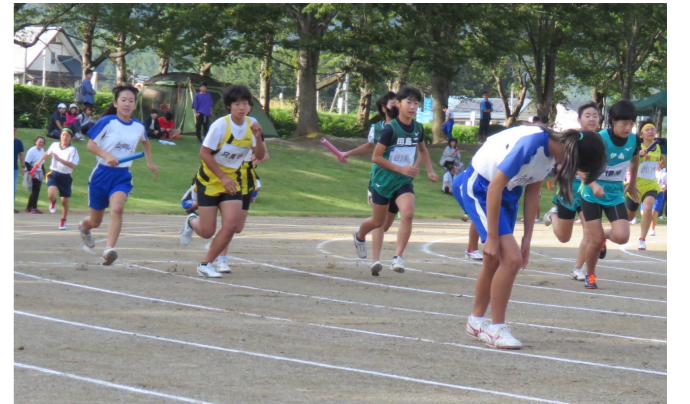
小学女子オープン4x100Mリレー決勝