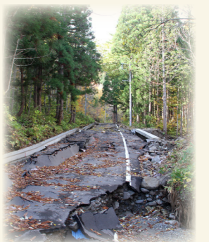
【福島県内の被害状況（10月24日現在）】

平成27年関東・東北豪雨の被災から再開通したのもつかの間、台風19号がもたらした大雨で再び不通となった町道東106号線