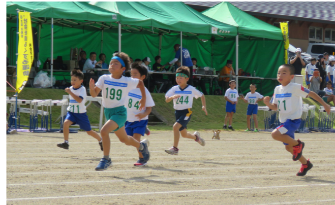
小学1年男子60Mタイムレース決勝

9月29日に開催されたびわのかけ陸上競技大会は、374人のアスリートが先人たちの記録に挑みました。あいにくの空模様でしたが、時間が経つにつれ天候も徐々に回復。8種目12クラスで大会新記録が生まれました。