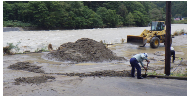
冠水した国道401号内川地内の復旧作業（13日午前8時30分頃）

▼午後7時頃、台風19号が強い勢力を保ったまま、伊豆半島に上陸。 ▼午後7時40分、館岩・伊南地域へ警戒レベル4を発令。 ▼午後7時50分、気象庁より大雨特別警戒が発令。 ▼午後8時45分、伊南川の浜野水位観測所で水位の上昇を確認。 ▼午後4時30分、これまでの災害情報を基に警戒レベル3を発令。各行政区の集会所も避難所とし、受け入れを開始。 ▼午後4時57分、気象庁より土砂災害警戒情報が発令。警戒区域の住民へ注意喚起。 ▼午後6時、夜間避難時の注意喚起と、屋内での垂直避難を勧告。 ▼午後7時頃、台風19号が強い勢力を保ったまま、伊豆半島に上陸。 ▼午後7時40分、館岩・伊南地域へ警戒レベル4を発令。 ▼午後7時50分、気象庁より大雨特別警戒が発令。 ▼午後8時45分、伊南川の浜野水位観測所で水位の上昇を確認。