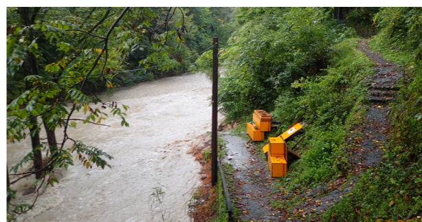
川岸の建物が流出した木賊温泉共同浴場「岩風呂」（13日午前7時頃）

上陸に備え24時間体制で警戒 町は、台風上陸前夜の11日午後3時に緊急の課長会議を開催。上陸に備えて、防災行政無線による注意喚起や自主避難所の開設、各課での対応事項を協議しました。 12日、24時間体制で警戒配備を敷いた町は、翌13日も配備を継続。この間、本庁と各総合支所間で災害情報を共有し、町民の安全を最優先に対策にあたりました。