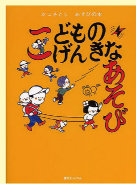
【おすすめ図書】かこさとしあそびの本シリーズ(1)～(4) かこさとし/作