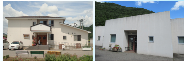
グループホーム花 南会津 館岩愛輝診療所

会社の合言葉は、「愛をもってひたすらに心をつくす」です。利用者の皆さまに、愛に輝いた心豊かな時間をいかにもっていただけるか、そのお力添えすることが全職員の仕事だと考えています。 この先も、地域の皆さまの医療や保健福祉に少しでもお役に立てよう努力し、南会津地域に必要とされる医療・介護サービスの提供と、地域に根付いた施設を目指します。