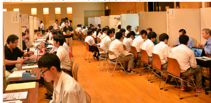
企業の説明を聞く高校生

8回目を数える「合同企業説明会」が7月26日、御蔵入交流館で開催され、過去最高となる39事業所と、田島・南会津・只見高校の生徒81人が参加しました。また、同日午前には、一般求職者やU・Iターン者などを対象に「合同就職面接会」が開催され、26事業所、32人の方が来場しました。 この事業は、町の雇用対策の一環として、若者の地元定着と地元事業所の働き手確保するために、大変重要な役割を果たしています。 今後も事業を継続しながら、双方への積極的な支援に取り組めます。