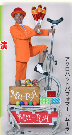
アクロバットパフォーマー「ムーラ」