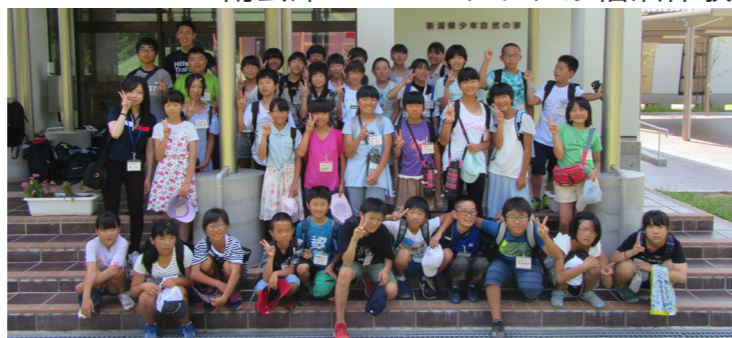
絆を深め合った子どもたち