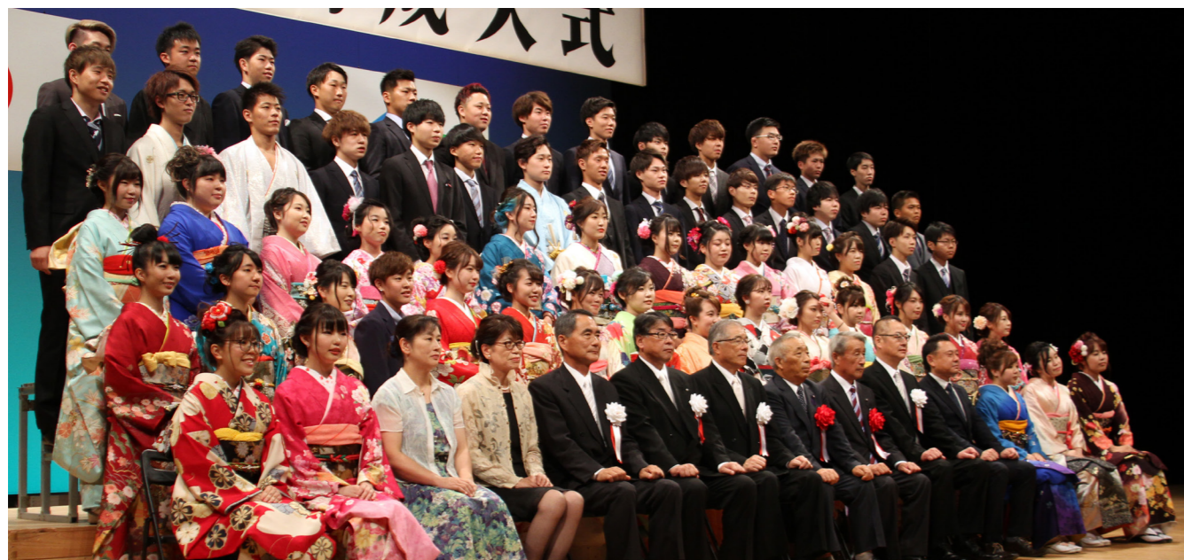
写真撮影の様子(田島中学校卒業生)