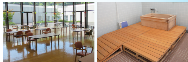
湯花里苑の食堂と個室風呂

当苑では、湯ノ花温泉という地域の特色を活かし、利用者の入浴には温泉を使用しています。本来の入浴は、清潔保持のほかに生活の中の楽しみであり、ゆっくりと心身ともにリラックスできる癒しの時間であるといえます。 老人保健施設本来の目的でもある在宅復帰を目指すために、家庭により近い環境で入浴ができるように、一人でも入浴できる個室にも取り組んでいます。