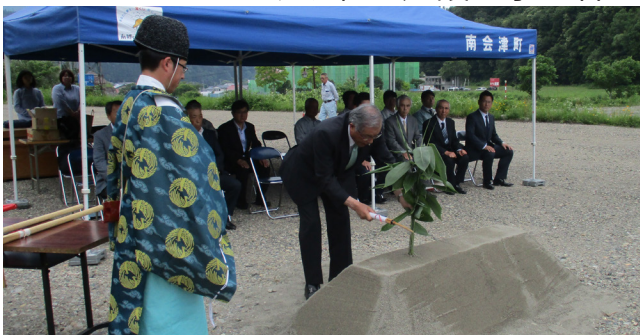
鎌入れをする大宅町長

6月27日、さゆり荘建設事業の第1期工事「パブリック棟建築工事」の安全祈願祭・起工式が南郷地域界地区で行われ、関係者約30人が出席し工事の無事を祈願しました。