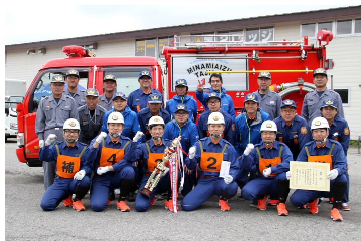
ポンプ車操法の部 優勝 第1支団第1分団第5部（長野）