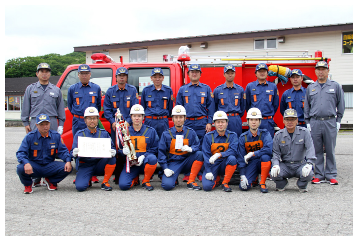
小型ポンプ操法の部 優勝 第1支団第1分団第6部（田部）