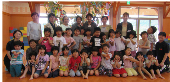
記した願いがかないますように

7月4日、びわのかけ保育所で七夕交流会が行われました。 田島寿学園の駒戸学級生と子どもたちが、一緒に作った色とりどりの七夕飾りや、願い事が書かれた短冊などを笹竹に飾り付けて、七夕交流を楽しみました。 出来上がった笹竹を前に、駒戸学級生と子どもたちの笑顔と笑い声が溢れていました。