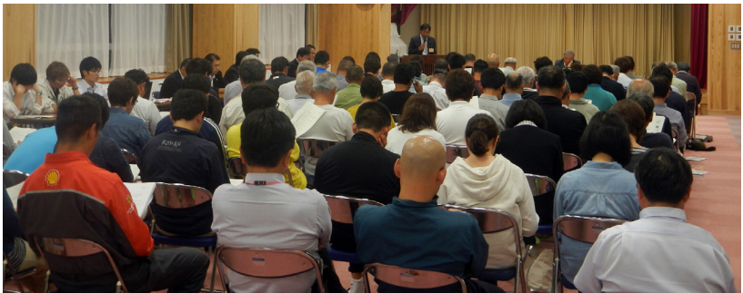
南郷地域の様子（6月24日＝南郷総合センター）

答 スキー場の地域に対する貢献度は計り知れません。今後も、冬期間の誘客やグリーンシーズンの活用、雇用対策などに責任をもつて取り組みます。