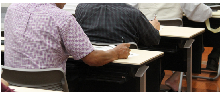
説明内容をメモする出席者（6月26日＝役場本庁舎）

答 まずは、荒海地区で手を挙げている地区から対応していきます。整備した農地を活用できる環境を整えるまでが、町の責任だと考えています。