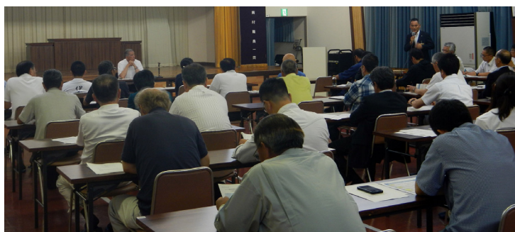
伊南地域の様子（7月5日＝伊南会館）

スクールバスと一般利用者が同じ車両で運行する方法やデマンド交通など、試験運行を重ねながら利便性の向上に努めます。