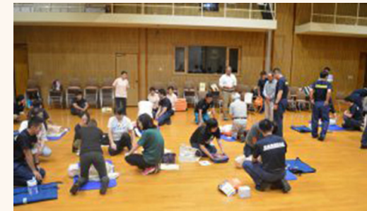
前回のフェアの様子(応急手当体験)