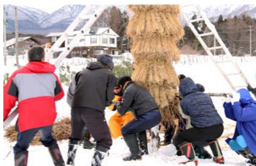
歳の神の突き刺しを繰り返す若者たち

2・3回繰り返して垂直を確認し、根本を固めてから、さらに周囲をワラで囲みます。2本の巨大な歳の神がそびえ立つ様子は圧巻です。