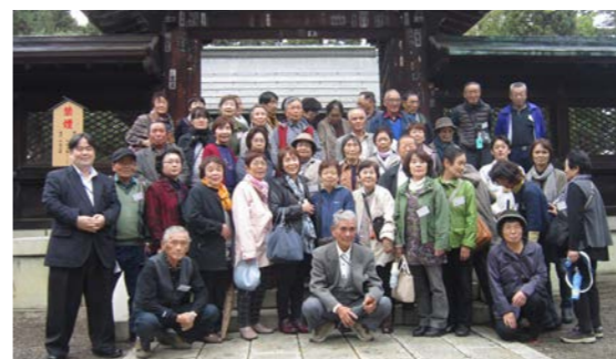
移動研修会（上杉神社＝山形県米沢市）