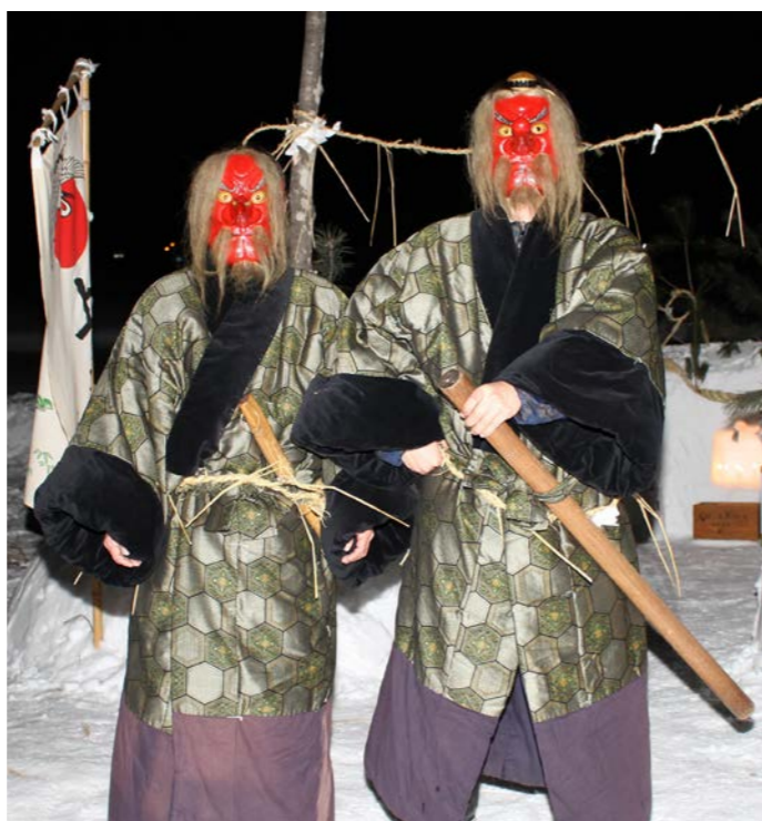
天狗の面を身につけ「田ノ神」を継承する厄年の男性