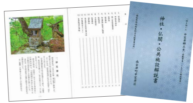
一つ一つの建造物を詳しく解説

「中荒井の歴史を残したい」その想いで平成29年に発刊した「中荒井郷土史」。その郷土史に掲載されている神社・仏閣・公共施設など13の建造物を、さらに詳しく伝えるための解説書が平成30年11月に発刊されました。 平成30年度福島県地域創生総合支援事業(サポート事業)を活用し、郷土史発刊の発展事業「ふるさと継承事業」として位置付けた取り組みは、解説書を通じて、ふるさとの歴史を学ぶ契機になればという期待が込められています。 なお、訪れた方が理解できるように、現地には「解説看板」も設置されています。