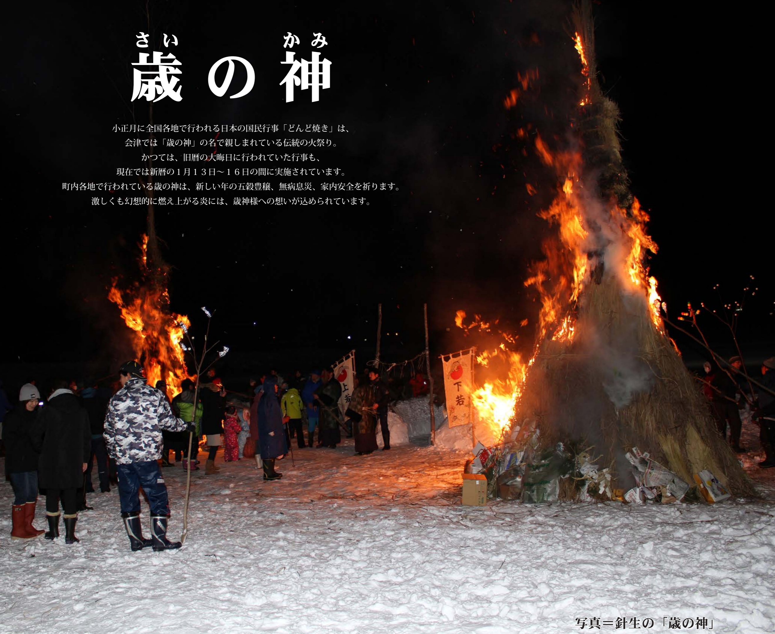
写真＝針生の「歳の神」