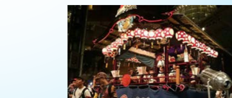
福島フェス（六本木ヒルズ）で展示された中大屋台

また、弊社に興味を持ってくださるお客さまと、協力してくださる業者さんへの感謝の気持ちを忘れずに仕事をさせていただいています。