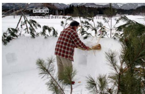
飾り付けが進む神棚

同時に、中央に集めた雪で、円形状に神棚が形づくられます。内側の3か所にろうそくを灯す「祠」が作られ、周囲に松の枝を巡らせて飾り付けます。