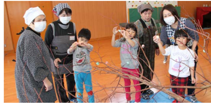
色とりどりの団子をさしていく子どもたち

1月11日、田島寿学園愛宕学級生とびわのかけ保育所の子どもたちが、団子さしを楽しみました。 4色の団子が茹であがると、木の枝にはりきって団子をさしていく子どもたち。さらに、ダンスや手遊びなどで交流を深めると、最後に年長児童から手作りのプレゼントが手渡されました。 保育所に飾られた見ごたえのある2本の団子の木には、保育所で生活している子どもたちが病気になるはず、元気いっぱい生活できるようにという願いが込められています。