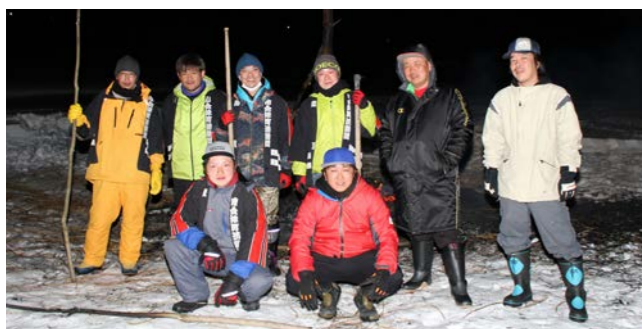
火の始末、最後は消防団の出番！