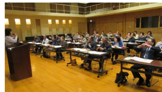
開講式の様子（御蔵入交流館多目的ホール）