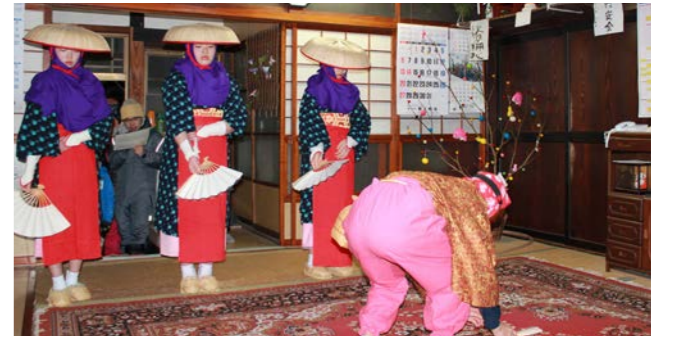
踊りを披露する子どもたち

南郷地域の伝統行事で、県の無形民俗文化財に指定されている「南郷地域早乙女踊り」が、1月12日に上町・上平地区、界・蛇の宮地区、鶴巣地区で、2月2日に下山地区でそれぞれ行われました。 集落内の区長や班長宅、新築や婚礼などのお祝い事があったお宅を回り、五穀豊穡と家内安全を祈願しました。 早乙女とひよっとこは集落の中高生が演じ、謡手は子どもから大人まで皆で務めながら、早乙女踊りを盛り上げました。