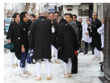
党本に集まる組中のみなさん

直会で「大杯回し」 参拝後に社務所で行われる直会。大杯になみなみとつがれた神酒を飲み干す、恒例の「大杯回し」では、「オン、サーン、ヤレカケロ！」の掛け声にあわせて1人ずつ順番に挑み、祭りの成功に向けた意気込みを示しました。