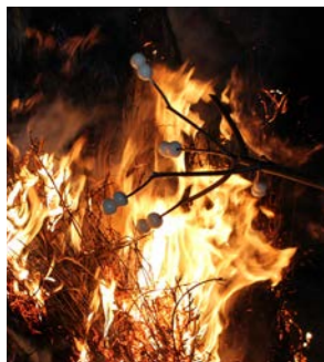
炎に焼かれる団子

夜、会場に現れた天狗が歳の神に火をつけると、集まった皆さんがその炎で団子やスルメなどを焼いて食べたりしながら、新年に祈りをささげていました。