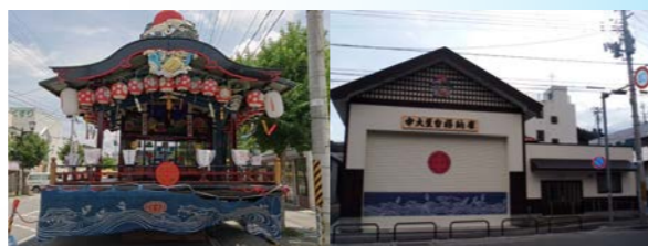
田島大火（1946年）で焼失した中大屋台の復興には、初代が屋台の装飾彫刻に携わり、2代目・3代目が屋台格納庫の工事に携わる。