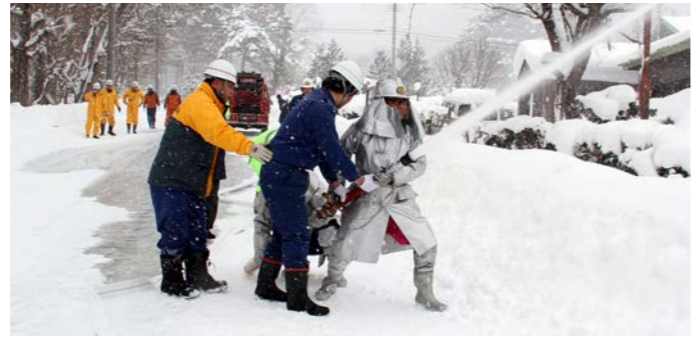
第1支団の訓練の様子(奥会津博物館)

1月27日、文化財防火デーに合わせて、田島・館岩地域で文化財防火訓練が行われました。 第1支団では、古今地内の「奥会津博物館」で火災が発生したとの想定で訓練を実施。訓練火災発生時の連絡が入ると、第3分団(荒海地区)の消防団員ら約100人が出動し、洗練された動きで本番さながらの消火活動が進められました。 第2支団では、館岩地域并桁地内の「鹿島神社」で訓練が行われ、貴重な文化財を守るための防火手順や防火意識を再確認していました。