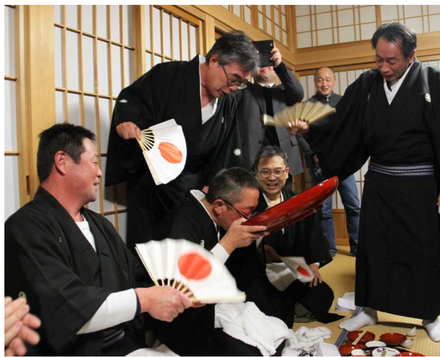
掛け声にあわせて勢いよく大杯の神酒を飲み干す