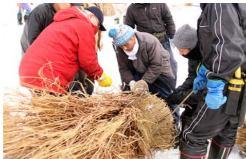
ワラをたたきながら締め上げていく

1月14日午前9時、消防団を中心とする若者から、知識と経験が豊富な高齢の方まで続々と男たちが集まり、伝統行事「歳の神」の準備が始まりました。重機と除雪機でやわらかい足場を固めながら、「神棚」を作るための雪が中央に集められます。