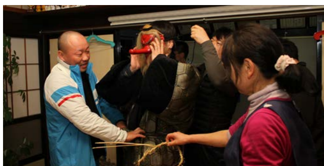
世話人たちの手によって衣装を身につけていく