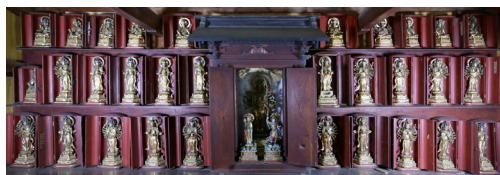
清水堂に祭られる三十三体の観音像

揮毫いただいた「町の漢字」は、額装して庁舎に掲示する予定です。楽しみにお待ちください。