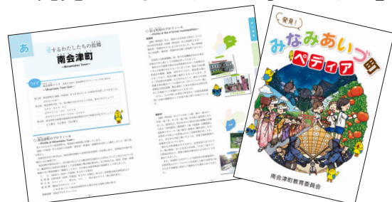
町の情報がたくさん詰まった副読本

「町ってどんなところ？」「町の良さは？」と思ったときに、とても役に立つ副読本が完成しました。