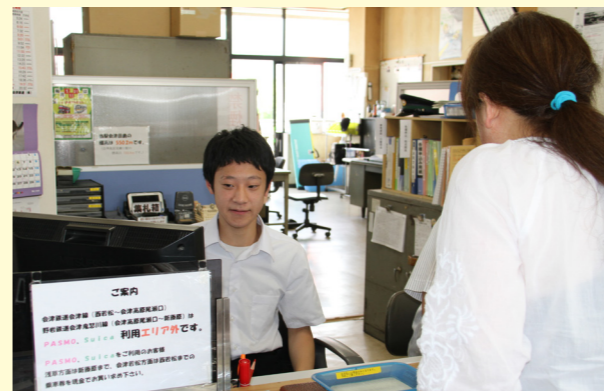
星くんは、切符の販売などを体験していました。お客さんへの丁寧な説明や、電車の運行状況などを確認する仕事も体験していました。