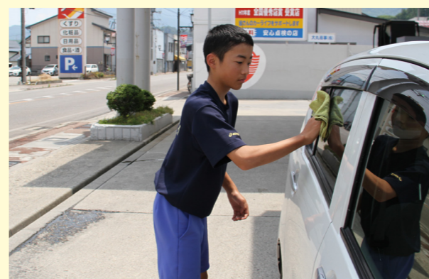
星くんは、ガソリンを入れにきたお客さんの車の窓拭きなどの接客を体験していました。暑い中での窓拭きは大変そうでした。また、大きな声で接客していました。