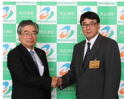
引継ぎを終えた新旧副町長