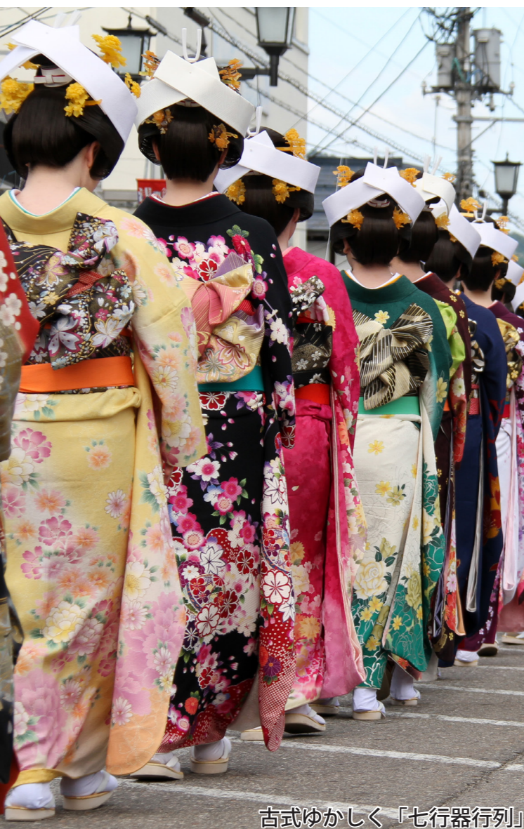
古式ゆかしく「七行器行列」