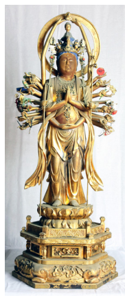
清水堂の本尊「千手観音像」

前日に訪れた南郷地域大橋地区の御蔵入札所第27番「清水堂」の本尊「千手観音像」が、京都・清水寺本堂のご本尊である「十一面千手観世音菩薩立像」と同じ、清水型千手観音（脇手のほかに左右2本の腕を真上に上げているのが特徴）と呼ばれるもので、「これも何かのご縁」と話されていました。