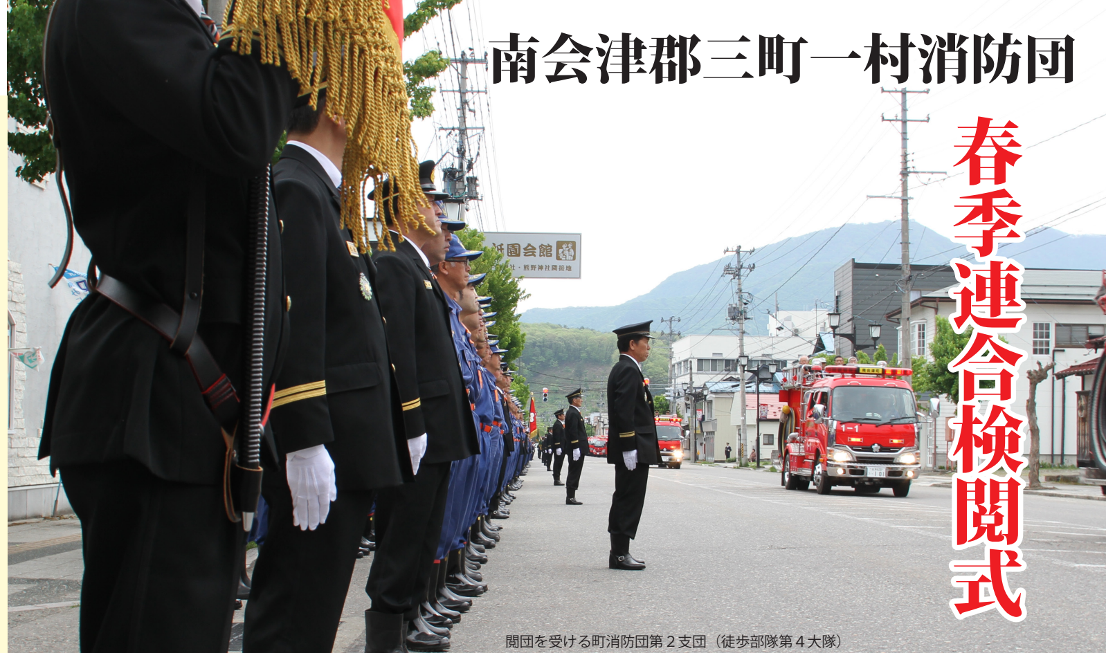
閲団を受ける町消防団第2支団(徒歩部隊第4大隊)

5月13日、南会津郡三町一村の消防団が一同に会して開催された、春季連合検閲式。自治体消防70周年を記念した節目の検閲式には、約850人が田島地域中心部の国道121号に結集しました。 国道では、5つに分かれた徒歩部隊や田島婦人消防隊、車両部隊の閲団や通常点検、分列行進が行われ、団員たちは日ごろの訓練の成果を發揮し、きびきびとした動きを披露しました。 御蔵人交流館で行われた表彰式では、消防活動での功労や功績をたたえ、各団員それぞれに表彰状が贈られました。(受章者は次のとおり。)