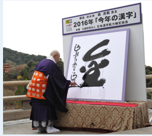
2016年「今年の漢字®」第1位「金」 (主催・写真提供(公財)日本漢字能力検定協会)

また、漢字の素晴らしさや奥深い意義を伝える ための啓発活動として、(公財)日本漢字能力検定 協会主催で行われている「今年の漢字®」の過去の 作品(レプリカ)を展示します。