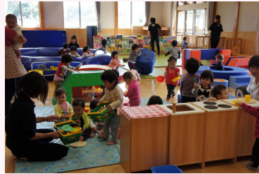
田島保育園子育て支援センター