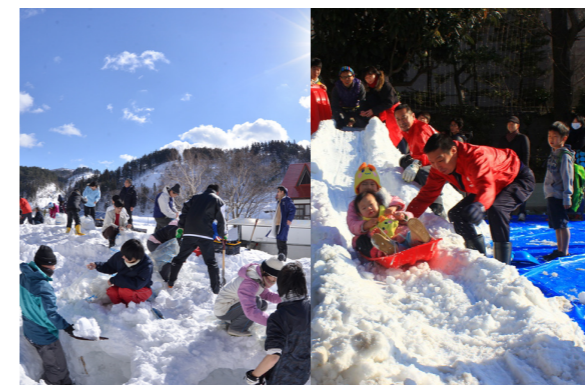
(みんなで雪詰めを行ったり、雪の滑り台を楽しみました。)

初日は文京区の大原青少年健全育成会の方々に来町、ホテル南郷前で雪詰めを行いました。2日目は文京区の小学校2校を会場に「雪の滑り台」や「かまくら」を南会津高校生の生徒たちと一緒に制作、普段触れることのできない雪の体験をみんなで目いっぱい楽しみました。