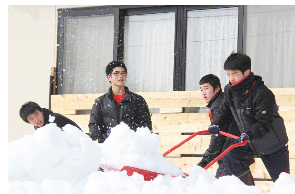
(高野地区で除雪作業する田島高校生徒たち)