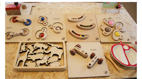
出産祝い等で好評のマストロ・ジェットペットのおもちゃ。インテリアとしても活用できます。