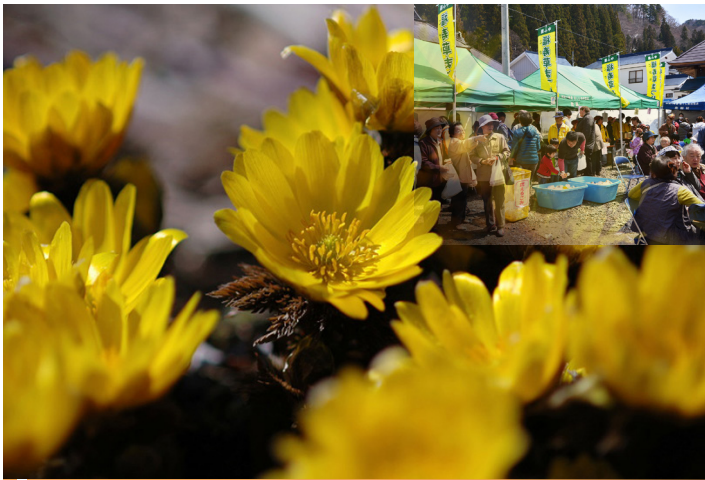
福寿草は、幸せと長寿を意味し、新春を祝う花として名付けられています。花言葉は「永遠の幸せ」

日時 4月9日(日) 午前10時～午後2時 場所 南郷地域 中小屋集落 料金 無料 催し よさこい、花笠踊り、餅まき、抽選会、チェーンソーアート、カラオケ大会、舞踊 出店その他 五目ふかし、南郷手作り餅、豚汁 中小屋集落では昔から福寿草のことを「こがね」と呼び、親しんできました。 問合せ (公財)南会津町振興公社 南郷支局 0241-72-2220