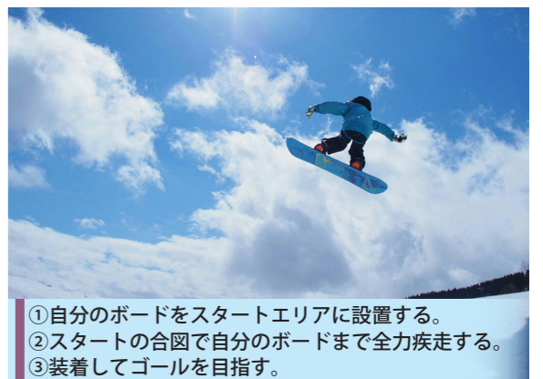
①自分のボードをスタートエリアに設置する。 ②スタートの合図で自分のボードまで全力疾走する。 ③装着してゴールを目指す。

チェーンズダウンヒルとは、スキー場山頂付近から麓まで誰よりも速く滑りきるシンプルかつエキサイティングなスポーツです。皆さまのご参加をお待ちしております。