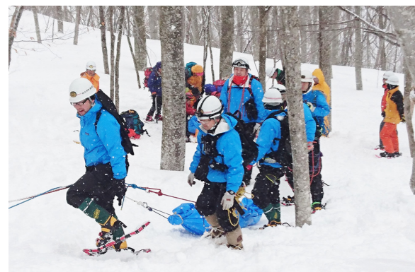
(当日は、だいらスキー場にある駒止リフト沿いで訓練を実施しました。)

2月26日、会津高原だいらスキー場において、冬山遭難救助訓練が行われました。当日は、南会津警察署、南会津広域消防本部、郡内消防団員、町山岳救助隊の約80人が参加。冬山で遭難者が怪我をしている状況を想定して、スノーシューおよびかんじきを履いての歩行訓練、さらにスノー担架等を用いて、怪我をしている遭難者を搬送するなど、実践さながらの訓練となりました。