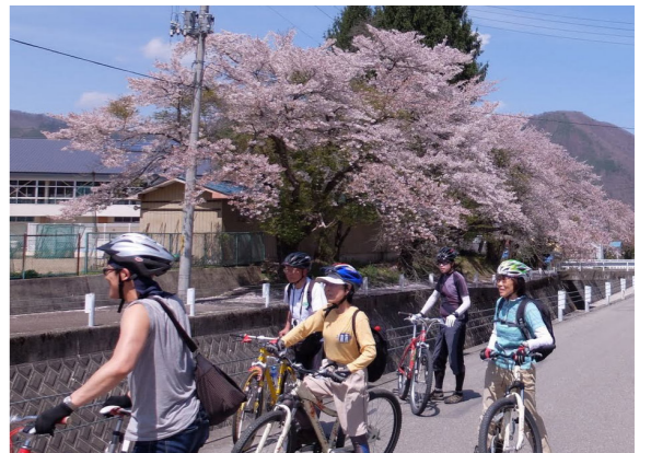
春の心地よい風を受けながら、田島地域にある桜の名所を巡りましょう！

南会津自転車を楽しむ会では、次のとおり「サイクリングお花見ツアー」を開催します。南泉寺のしだれ桜、田島ダム、高野の種時桜など田島地域における桜の各名所を巡ってみませんか？ 皆さまのご参加をお待ちしております。