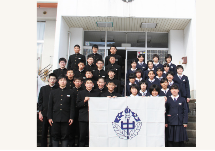
表紙 theme 「思い出の校舎と」

は誠に残念ではありますが、本校の教育理念や精神、そして輝かしい足跡は皆さまの心に残り、いつまでも語り継がれていくとともに、生徒たちも「檜沢中の誇り」を忘れることなく、新しい友人たちと共に「新生田島中」の新しい歴史を創っていくてくれるものと信じています。