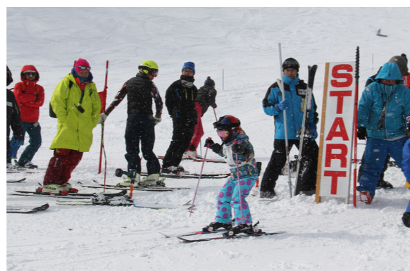
(最初に行われたキッズ女子の部の様子。大きな声援のもと、子どもたちは精一杯滑りました。)

アルペンではキッズから50歳以上の部まで計84人が参加、クロスカントリーでは個人の部で46人、リレーの部で8チームが参加して、各部門ごとに日頃の練習の成果を競い合いました。