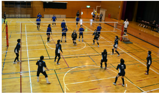
試合は常に真剣勝負！でも交流大会は笑顔も大切！！

平成28年は、町と東京都台東区が友好都市を提携して30周年という記念の年でした。そこで昨年は、町婦人バレーボール愛好会の協力で台東区に出向き、記念事業として第1回バレーボール交流大会が開催されました。そして平成29年は、台東区バレーボール連盟が来町し、第2回の交流大会を10月7日に田島小学校体育館で開催。1年ぶり