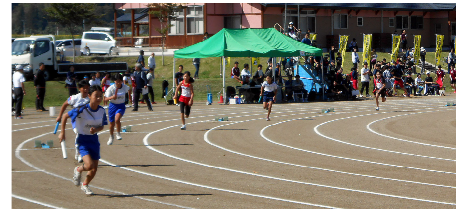
記録更新を目指す選手たち（小学女子4×100Mリレー）

9月24日、秋晴れのもとで開催されたびわのかげ陸上競技大会は、年長児童から73歳までのアスリート492人が先人たちの記録に挑み、10種目18クラスで大会新記録が生まれました。