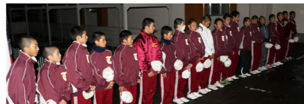
決戦の舞台青森へは前日金曜日の夜に出発