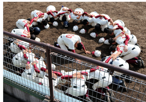
試合前の円陣でチームの心を一つに