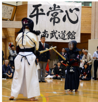
真剣勝負に挑む選手たち

9月30日と10月1日の2日間にわたり、「第38回伊南武道館少年剣道大会」が伊南武道館と伊南地域交流センターで開催され、県内外より149チーム、延べ864人の選手が出場し、日ごろ修練した技による熱戦が繰り広げられました。