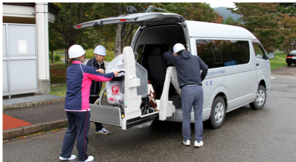
福祉車両を使用した訓練の様子