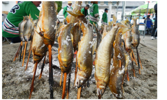
焼き場に並ぶ鮎はまつりの目玉

10月15日、「伊南川あゆまつり」秋の「収穫祭」が古町農村公園で開催されました。