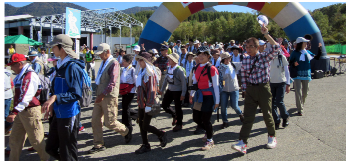
ウォーキング2日目のようす (たかつえスキー場)

9月30日から10月1日の2日間にかけて、33回目となるさいたま市・南会津町たていわ親善ツアーデーまちが開催されました。当日は秋晴れのもと、さいたま市から約160人が参加。初日は前沢曲家集落を見学し、湯ノ花地区から館岩会館までを町民参加者と一緒にウォーキングをしました。2日目は、高杖原地区でウォーキングをした後に「裁ちそば」や「ぼんでもち」などが振る舞われ、さらに会場では特産品の販売も行われました。