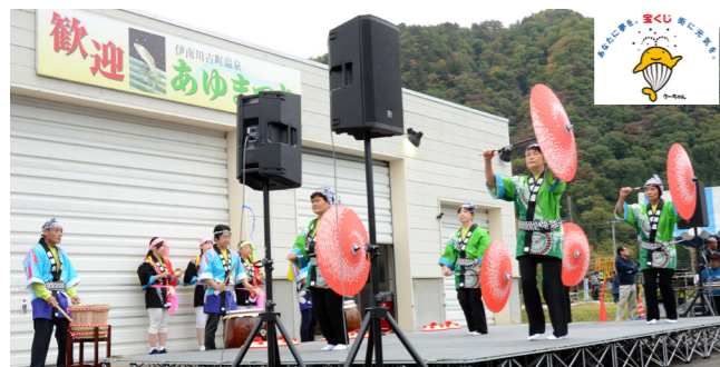
「伊南川あゆまつり」で踊りを披露（10月15日）

地域の芸能として1930年ごろから伝わる「青柳八木節笠踊り」。 一時、踊りが途絶えてしまいましたが、平成19年に地区の有志により結成された「青柳八木節ものずき隊」によって、およそ20年ぶりに復活しました。 踊りは、大桃夢舞台や伊南川あゆまつりのほか、地区の催しでも披露され、活動を通してコミュニティの形成にもつながっています。 この度、古くなった衣装や楽器を助成事業を活用して新調し、新しい振り付けなどにも取り組みながら、地域のイベントで積極的に踊りを披露するなど、今後の活動が期待されます。