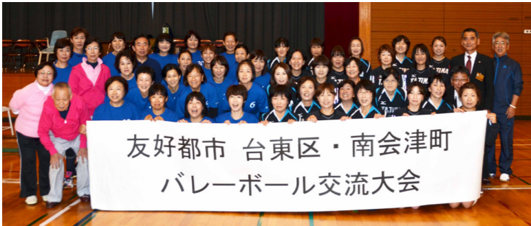
再会を喜ぶ両チーム

に再会した球友たちは会話が弾み、白熱した試合の中でも笑顔があふれる素晴らしい大会になりました。今後このような相互交流が開催され、町と台東区の絆がより一層深まるといえます。