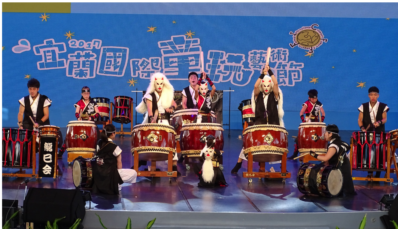
オリジナル曲「天狐白狐」を勇壮に演奏するメンバー