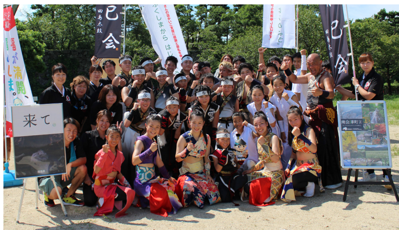
転輪太鼓のメンバーと記念撮影

この事業は、福島県の子どもたちが、復興に貢献しようという想いを高めている今、その想いを形にする機会を提供し、復興に寄与する社会体験活動を通して、新生ふくしまを担うたくましい子どもたちを育成する目的で実施されています。