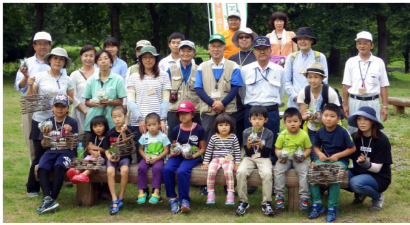
地域の自然に親しんだ参加者

8月19日、伊南地域青柳地区久川ふれあい広場周辺で、南会津地方緑化推進委員会の主催による「第30回ファミリー緑の教室」が開催されました。 当日は、南会津郡内の子どもたちとその家族ら18人が参加し、ガイドや講師の皆さんと一緒に、久川城跡の自然観察や木工クラフト、こけ玉づくりなどを体験しました。 参加者たちは、自然に親しみながら夏休みのよい思い出になる1日を過ごしました。