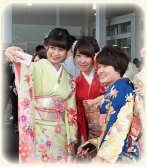
今月の表紙 新成人の晴れ舞台「成人式」 開式前のひとときをスナップ