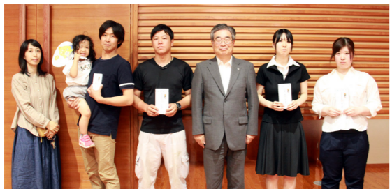
◆定期的に交付金を贈呈しています◆ この交付金は定期的に贈呈式を開催しています。対象の有無はお問い合わせください。 ※写真は第1回贈呈式の様子(7月26日)