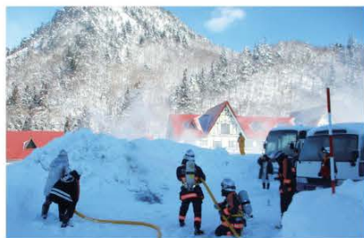
(南郷地域における訓練の様子。当日は広域消防署の消防隊員指導のもと、放水活動が行われました)

訓練では、団員たちによる正確な伝令や水槽付きポンプ自動車を使用した放水活動など実践さながらの訓練が行われました。