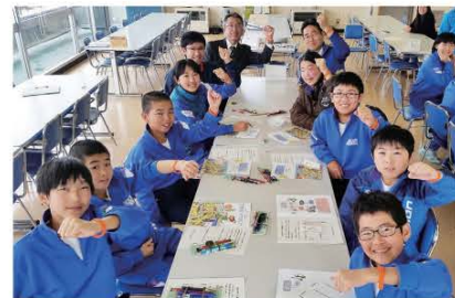
(認知症の人を応援しようという意味のオレンジリングが受講者へ贈られました)

講座では、お年寄りの身体の不自由さを疑似体験できる器具や認知症を正しく理解するための教材を活用し、相手の立場になって考えることの大切さを学びました。