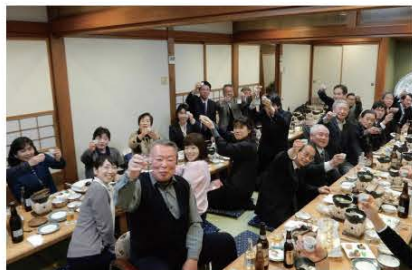
(キャンペーンを盛り上げるため集まった、郡内の飲食関係者および商工会等の皆さん)

☎ 地酒で乾杯プロジェクト事務局 (町観光物産協会内) 0241-62-3000