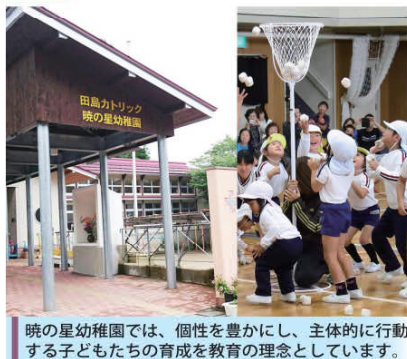
暁の星幼稚園では、個性を豊かにし、主体的に行動する子どもたちの育成を教育の理念としています。