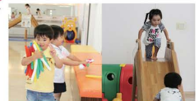
健診ホールには、子どもたちが楽しめるおもちゃや遊具がたくさんあります。