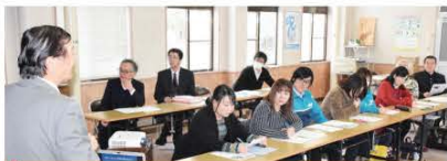
観光客の方々におもてなしをするため、各講座に参加する皆さん