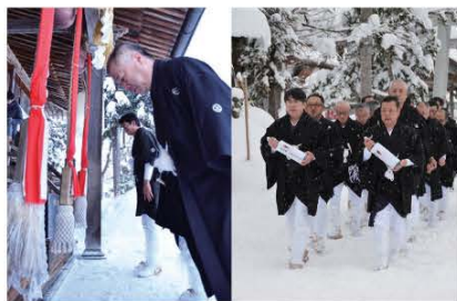
(祇園祭の成功を祈り、神社の参拝を行ったお党屋組の皆さん)

御党屋の皆さんは、神社内の拝殿と手水舎の間を何度も往復し、祇園祭の成功を祈願しました。