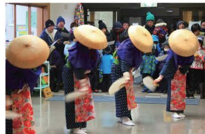
(田植えのしぐさで踊る早乙女踊。県の無形民俗文化財に指定されています)

雪がしんと降り積もる中、唄い手の元気な声が響き渡り、今年もまた地域の伝統が受け継がれていきます。