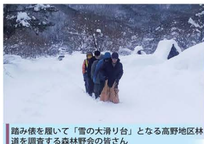
踏み俵を履いて「雪の大滑り台」となる高野地区林道を調査する森林野会の皆さん

森林野会（もりのかい） じね～んの森事業部 minamiaizu.snow@gmail.com