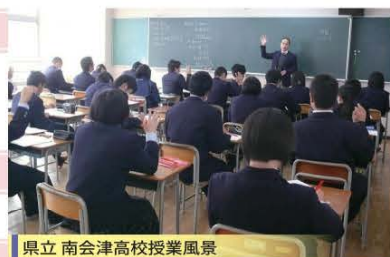
県立南会津高校授業風景

問 学校教育課 学校係（御蔵入交流館内） 0241-62-6300 教育委員会分室 学校教育係（伊南総合支所内） 0241-76-7718