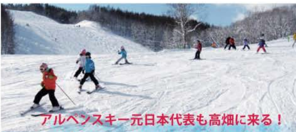
アルペンスキー元日本代表も高畑に来る！