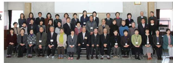
(田島地域における「民生委員・主任児童委員」の皆さん)

12月1日に館岩、伊南、南郷地域で、12月8日に田島地域において、民生委員・主任児童委員委嘱状交付式が行われました。3年に1度の改選となっており、主な業務として、民生委員は各地区のひとり暮らしや寝たきりの高齢者などの援助活動や地域福祉に関する相談に応じて、暮らしを支援します。児童委員は児童や乳幼児、妊産婦などの相談や援助を行います。現在、日常の暮らしの中でお困りごとを抱えている場合は、最寄りの民生委員・児童委員にお気軽にご相談ください。