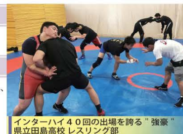
インターハイ40回の出場を誇る「強豪」 県立田島高校レスリング部