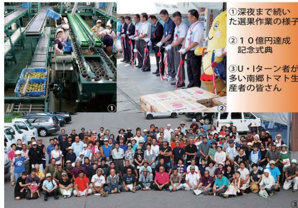
①深夜まで続いた選果作業の様子 ②10億円達成記念式典 ③U・Iターン者が多い南郷トマト生産者の皆さん

平成28年度の南郷トマトの販売額が過去最高となる10億6,200万円を記録、平成6年以来22年ぶりの快挙を達成しました。出荷量においても85万1,000ケース、3,400トンを超え、過去最高となっています。昭和37年に50アールから始まった南郷トマト栽培は、今年で55年目を向かえ35ヘクタールを超えるまでに成長し、今後産地拡大に向けたさらなる飛躍が期待されます。