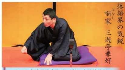
落語界の気鋭 はなし 新家 三遊亭兼好

祇園会館において、次のとおり寄席を開催します。本場の寄席を生で聴いてみませんか？皆さまのご来場をお待ちしております。