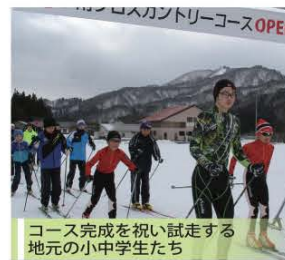
コース完成を祝い試走する 地元の小中学生たち

12月25日、伊南地域で整備を進めてきた全日本スキー連盟公認の伊南クロスカントリーコースのオープン記念式典が盛大に執り行われました。式典では地元の小中学生が試走を行い、その完成を祝いました。 この公認コースは、県内で3か所目となっており、夏は陸上競技の練習や町民の健康ウォーキングにも活用できるよう整備されています。 今後、町および伊南スポーツツーリズム実行委員会では、県内外の合宿誘致を積極的に図り、地域活性化につなげていきます。 なお、全日本スキー連盟の調査員からは「高低差のある林間コースとしては、国内有数なことから全国的な大会も誘致可能である。」と高い評価を受けています。 このクロスカントリーコース完成の裏には、地域の方々の涙ぐましい努力がありました。今回の特集では、完成に至るまで尽力された地域の方々の声をお届けします。