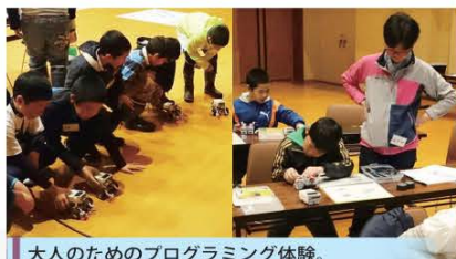
大人のためのプログラミング体験。 みんなで楽しく学びましょう！

今回、より多くの方々にご理解、ご協力をいただくため、次のとおり「大人のためのロボラボ体験教室」を開催します。皆さまのご参加をお待ちしております。