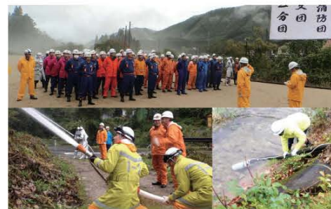
震災、水害等あらゆる有事に備えて実践形式の訓練を充実。状況判断、指揮能力の強化にも努めています。

今回の訓練は、水利の確保が難しい高台や消防車両を何台も連結させなくてはならない難易度の高い箇所を設定。団員たちは実践さながらの素早い動きで消火活動に努めました。