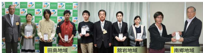
〇商工観光課 商工振興係 0241-62-6200