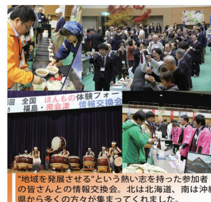
「地域を発展させる」という熱い志を持った参加者の皆さんとの情報交換会。北は北海道、南は沖縄県から多くの方々が集まってくれました。