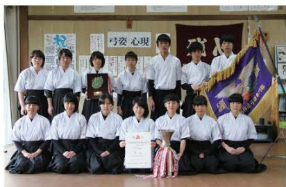
(30年ぶりの快挙を達成した県立田島高校弓道部の皆さん。弓道部では部員も随時募集、弓道は頑張りたい方で上達できるとのことです。)