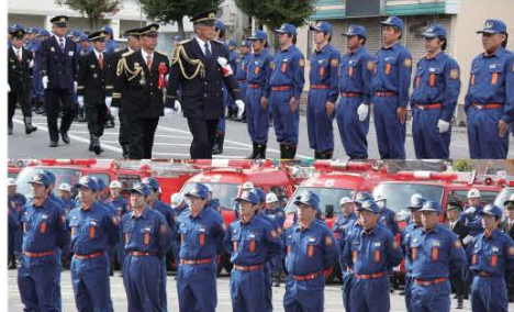
写真上は検閲官による団員の様子。写真下は小隊訓練、団員たちの士気を高める素晴らしい動きを披露。

また、表彰式では消防活動での功労や功績をたたえ、各消防団員に表彰状が贈られました。