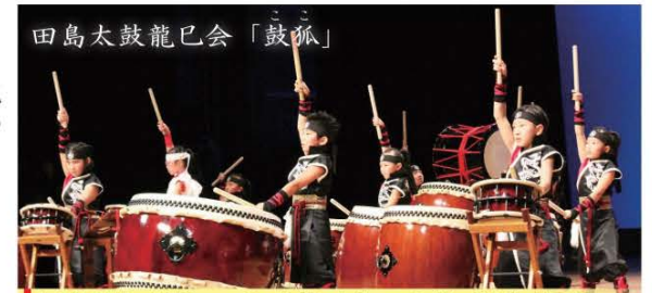
南会津地域の小学生16人(小学1年生～5年生)が力強く軽快な和太鼓を演奏します。