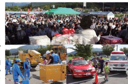
(写真上は大抽選会の様子。当日は普段乗ることのできない特殊車両等に乗りこむことができました。)

当日は地元商店の出展はもとより町内事業所の紹介、田島太鼓龍巳会による太鼓演奏、息吹による舞踊、自衛隊や警察署、消防署等の協力により普段間近に見ることができない特殊車両の試乗や大抽選会など多くの催しが行われ来場した皆さんを大いに楽しませてくれました。