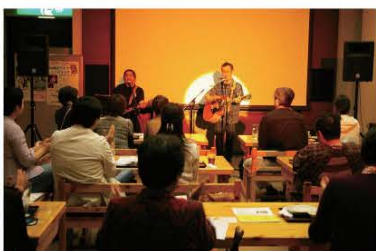
シックで落ち着いた雰囲気漂う癒しの空間。一緒にライブ&ディナーを楽しみませんか?

祇園会館 0241-62-5557 aizutajima@gionkaikan.biz-web.jp