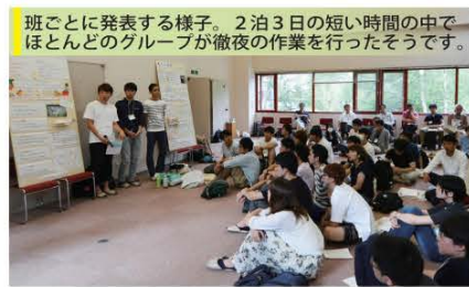
班ごとに発表する様子。2泊3日の短い時間の中でほとんどのグループが徹夜の作業を行ったそうです。

「屋」やこの地域の各観光スポットに簡易式の休憩所を建て、憩いの場を作るといった内容もありました。この2つのポイントは、地区と森林組合、ボイスが連携し、途切れない雇用を生み出すことにあります。各観光スポットに休憩所を設ける場合は、あらかじめ3年で建て替えるように建築、効果を検証して次に生かすといった形でサイクルさせていく内容となっています。なお、詳しい内容を現在、芝浦工業大学セミナーハウスに展示してありますので、ぜひ一度お越しになってください。どなたでも入場できます。