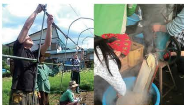
様々な自然体験をベースに面白い活動をみんなで模索します。

南会津ハッピーカンパニー事務局 minamiaizu.h.c@gmail.com