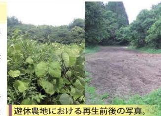
遊休農地における再生前後の写真。