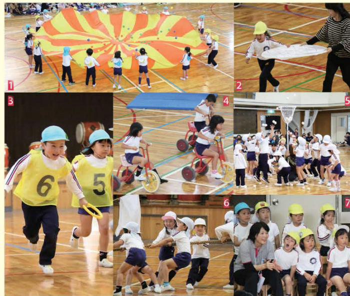
photo collection 秋の大運動会