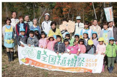
(秋晴れに恵まれ、紅葉も始まりだした館岩地域。植樹に頑張った館岩幼稚園児たちとの記念の一枚です。)

当日は館岩幼稚園児たちが桜の苗木を植えるために集まってくれました。園児たちは南会津森林組合 館岩支部のみなさんの指導のもと、苗木を丁寧に植えていき、自分たちの名前を書いたプレートをつけていきました。