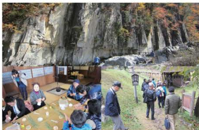
伊南地域の大桃地区「屏風岩」、館岩地域前沢地区「前沢曲家集落」を巡った参加者の皆さん。伝統工芸品も制作しました。

今後、町では今大会で得た内容を一つの判断基準とし、町に合う独自の観光資源の活用法を検討しながら随時、政策に反映させていきます。