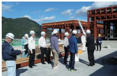
(新庁舎建設現場見学会の様子。写真は屋上を見学するワークショップ委員と関係者の皆さんです。)