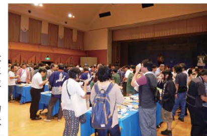
(1日目の下郷ふれあいセンターで行われた歓迎交流会。こづゆ、ぼんていもち、しんごろうなどの郷土料理が振る舞われました。)

当日は全国から集まった参加者と地元住民、合わせて約400人が参加。現地見学会や意見交換会等が行われ有意義な時間を過ごしました。町ではこの大会を通して再発見した当地域の魅力や価値を観光資源に反映させ、県内外へのPRを積極的に進めていきます。