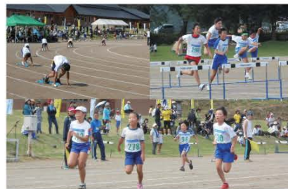
(秋空の快晴のもと、各種目に取り組む選手たち。年齢別に13種目あり、大会新記録が合計で12種目も続出しました。)