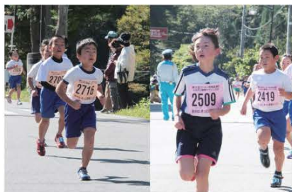
(ゴール間近、ラストスパートをかける選手たち)

10月16日、館岩グラウンド内において、第31回ゴーマン杯南会津町ふるさと健康マラソンが開催されました。今回は、昨年度の豪雨災害で走ることができなかったハーコースも復活。全27部門で選手たちはその健脚を競いました。今年の出場者は、総勢528人で県外からの参加者は348人となっています。また、選手たちに地区の方々によるきのこ汁が振る舞われ、マラソンを通して町民との交流も図ることができました。