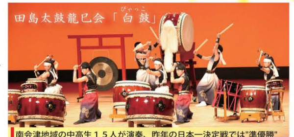
南会津地域の中高校生15人が演奏、昨年の日本一決定戦では"準優勝"に輝いています。