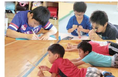
(昔ながらのおもちゃで楽しむ松沢小学校児童たち)

その昔、子どもたちのおもちゃだった「割り箸鉄砲や切り絵、万華鏡」などを一緒に作成。手作りおもちゃの遊び方も教わりながらみんなで楽しみました。