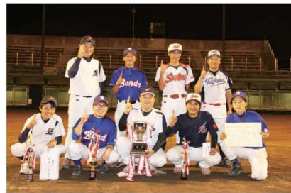
(少精鋭で今大会を勝ち抜き、見事優勝に輝いた長野チームの皆さん。優勝おめでとうございます)