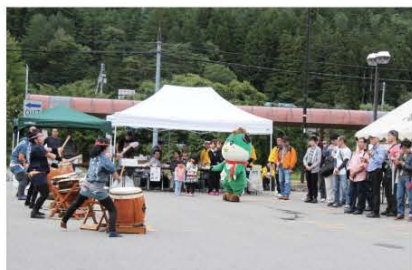
(祇園太鼓による力強い演奏でお出迎え。滝原地区の方々にはイベントを成功させるべく、何日も前から準備をしておいたそうです。)

10月1日、会津高原尾瀬口駅において東武トップツアー(株)主催の「野岩鉄道(株)開業30周年記念往復貸切臨時列車日帰りツアー」が開催されました。当日は県外からお越しの約100人のお客をおもてなし。滝原地区の協力のもと、きのこ汁やしんごろうが振る舞われた後、様々な体験型アトラクションが行われました。ある参加者は「普段は車で訪れますが、鉄道でのんびり景色を眺めながらの旅もとても楽しかったです。」と話してくれました。