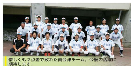
惜しくも2点差で敗れた南会津チーム。今後の活躍に期待します。