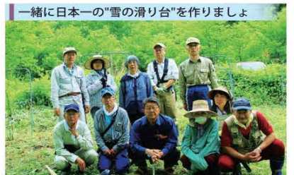
一緒に日本一の"雪の滑り台"を作りましょ 森林野会(もりのかい) じね〜んの森 事業部 「日本一の雪の滑り台を実現する実行委員会」 minamiaizu.snow@gmail.com

田島地域高野地区に広がる「じね〜んの森」! 南会津地方は、県内でも有数の豪雪地帯です。「日本一の雪の滑り台を実現する実行委員会」では、この森を活用して日本一長い雪の滑り台を作り、町の子どもたちと元気いっぱい遊ぶための構想を練っています。一緒に子どもたちの笑顔の輪を広げてみませんか? 皆さまのご参加をお待ちしております。