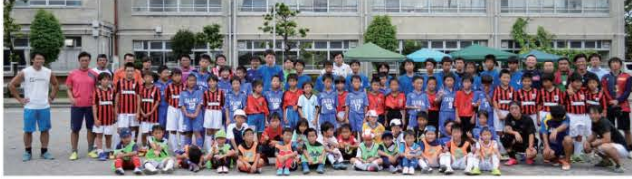
(友好都市さいたま市で指扇サッカー少年団と交流を深めてきた児童・生徒たち)

友好都市交流事業として、今年で4回目となる「さいたま市・南会津町"絆"事業」が8月20日から21日の2日間に渡って行われ、小学生の「田島サッカースポーツ少年団」と中学生の「南会津FC」がさいたま市を訪れました。さいたま市と大宮アルディージャの協力により、選手の入場をハイタッチで迎えたり、ウォームアップをピッチで見学させていただくなど貴重な体験ができ、地元の指扇サッカー少年団とも交流した児童・生徒たちは、さいたま市との絆を深めてきました。