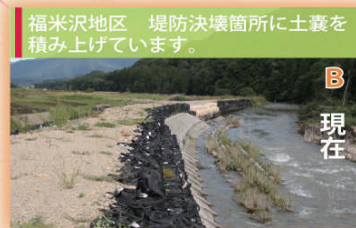
福米沢地区 堤防決壊箇所 ※ に土壌を積み上げています。