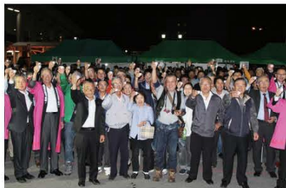
(南会津の地酒で乾杯する参加者の皆さん)

当日は会津酒造、開当男山酒造、国権酒造、花泉酒造の4蔵元による自慢の地酒が振る舞われ、約300人の参加者がその味を堪能、午後6時30分には一斉に乾杯をしました。乾杯後には地酒が当たる抽選会も行われ、大いに盛り上がりしました。