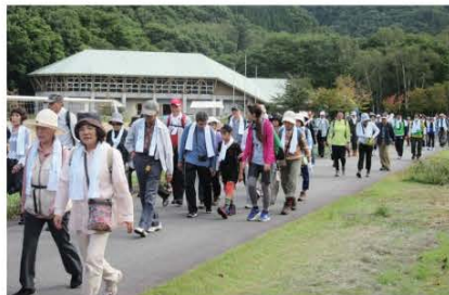
(さいたま市からお越しの参加者たち。写真は初日におけるしらかば公園スタート直後の様子です。)

2日目は高杖原地区でウォーキングが行われた後、「新そば」が参加者の皆さんに振る舞われました。