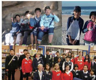
異文化交流での様々な体験は、彼らの貴重な財産となり、今後の将来に大いに役立つことでしょう。

私はこれまで勉強した英語力を海外で実際に試したいと考え、この事業に参加しました。オーストラリアでの研修は、私にとって全て貴重な体験でしたが、その中でもホームステイは、一般家庭の方と一緒に実際に生活することで、日本の生活との大きな違いを感じる事ができました。また、一緒に生活をする中で会話を聞き取れないことが多くあり、現在の自分の英語力でコミュニケーションを取る事が非常に難しいことを実感しました。しかし、相手に伝えたいという気持ちでできるだけ会話をしようという心がけ、研修前よりも自分が積極的になれたと思います。今回の海外交流事業において、多くの関係者の方々の応援や協力があったことに感謝の気持ちでいっぱいです。