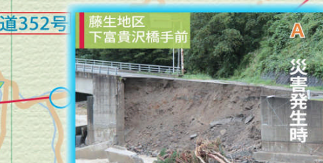
藤生地区 下富貴沢橋手前 現在