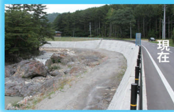
新田原地区 国道352号