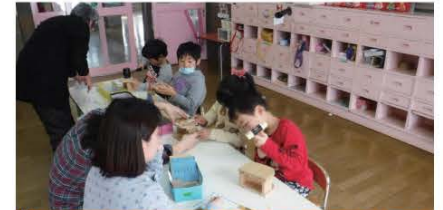
子どもたちに山村文化に触れてもらうことで今後の地域発展および文化継承の願いが込められています。

また、子どもたちだけではなく、お父さんやお母さんにも呼びかけて地域一体となって子どもたちを育てていき、地域を愛する気持ちや守り育てる意識を育んでいきたいと私たちは考えています。