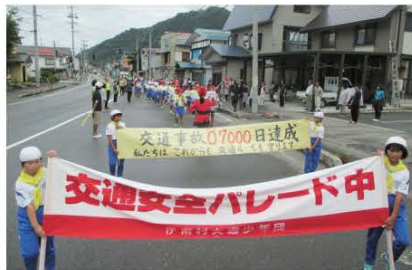
(交通事故ゼロ7,000日達成の横断幕を掲げパレード行進する伊南小学校児童たち)

町交通対策協議会が主催となり、9月14日に南郷地域、15日に伊南地域、16日には田島地域と館岩地域でそれぞれドライバーおよび歩行者等の交通安全に対する意識高揚を図ることを目的とした交通安全パレードが実施されました。伊南小学校では今年の6月15日に「交通事故ゼロ」7,000日を達成し、伊南地域としては12月には「交通死亡事故ゼロ」7,000日を達成する見込みです。当日は伊南小学校全校児童など約70人が参加。7,000日達成の横断幕を掲げ、住民に対する交通安全を呼びかけました。