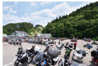
(バイク総数1,000台を超える圧巻の風景)