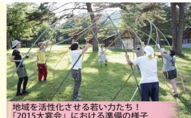
地域を活性化させる若い力たち! 「2015大宴会」における準備の様子