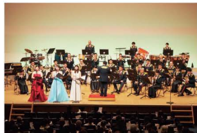
(「町民の歌」を歌う桐朋学園芸術短期大学生の皆さんと演奏する陸上自衛隊第6音楽隊の皆さん)