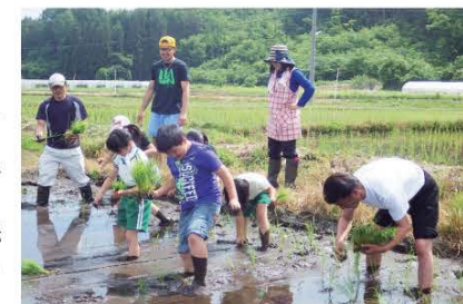
(「ひとめぼれ」の苗を丁寧に植える子どもたち)

当日は子どもたち20人を含む合計40人の地区住民が参加。晴天の中、子どもたちは泥だらけになりながらも「ひとめぼれ」の苗を丁寧に植えていきました。