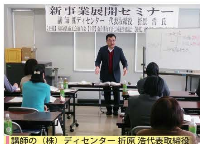
講師の（株）ディセンタ代表取締役

① 国の創業・第二創業促進補助金を活用するためには、本講座を4日以上出席いただく必要があります。