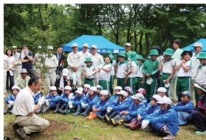
(植樹方法の説明を受ける児童たちと関係者)

当日は関係者をはじめ、伊南小学校児童、田島第二小学校緑の少年団、地元住民など約100人が参加。同広場内におオヤマザクラ、コハウチワカエデ等の約70本の苗木が植えられました。また、緑化功労者として青柳地区が南会津地方緑化推進委員会より表彰され、委員会へ毎年ご寄付されている（株）高島屋へ感謝状が贈呈されました。