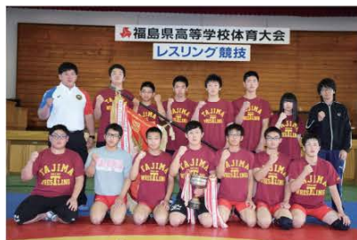
(記念すべき「40度目の優勝」を果たした県立田島高校レスリング部の皆さん)