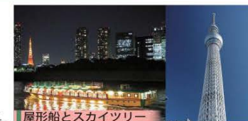
屋形船とスカイツリー

往復乗車代（浅草駅～会津田島駅）、往復特急代（浅草駅～鬼怒川温泉駅）、地下鉄乗車代、各施設入場料、宿泊代、屋形船食べ飲み放題、保険料