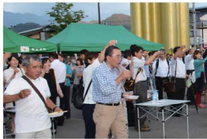
(町の乾杯条例制定3周年を記念し、乾杯する来場者の皆さん)