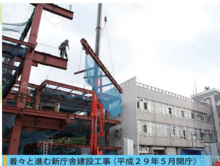
着々と進む新庁舎建設工事（平成29年5月開庁）