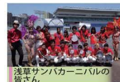
浅草サンバカーニバルの皆さん