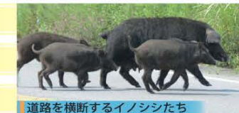
道路を横断するイノシシたち

一般社団法人福島県猟友会に事業を委託して捕獲を実施します。 実際に捕獲する人は、県から「従事者証」を交付された地元の猟友会の方々です。 「福島県指定管理従事者」の腕章をしています。