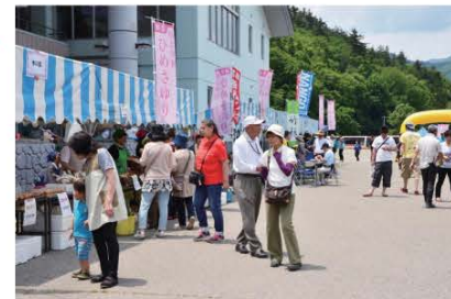
(最盛期のひめさゆりを一目見ようと訪れた来場者の皆さん)

また、ステージイベントでは南会津高校生による郷土芸能「早乙女踊り」の披露のほか様々な催しで会場は大いに盛り上がりました。