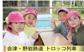
会津・野岩鉄道 トロッキョ列車

会津・野岩鉄道利用促進協議会や南会津町公共交通対策協議会では多くの皆さんに会津・野岩鉄道を利用していただくため、鉄道運賃の一部を助成しています。