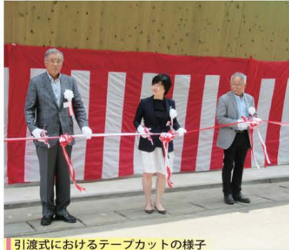
引渡式におけるテープカットの様子