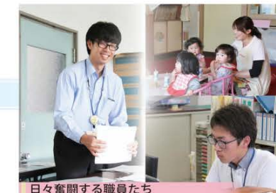
日々奮闘する職員たち