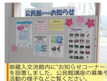
御蔵入交流館内に「お知らせコーナー」を設置しました。公民館講座の募集や活動の様子などご覧ください。

図書館の本以外は返却ポストには入れないようご注意ください。 万が一、間違って入れた場合は図書館までご連絡ください。また、ご寄贈の本がございましたら、返却ポストには入れず、必ず図書館の窓口までお持ちくださいますようお願いいたします。