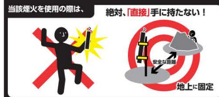
農林課 林政係 0241-62-6220

有害鳥獣を追払う際に使用される「花火」について、全国で暴発による事故が発生しております。 火薬を使用しており暴発の可能性が常にあります。事故を起こさないよう製品は、直接手に持たず杭などに固定し安全確保のうえ、正しく使用してください。