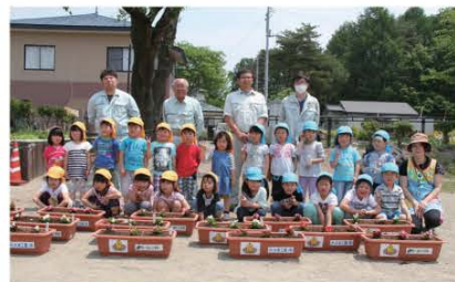
(元気よくお花を植えた田部原保育所の子どもたち)

当日はベコニア50株、マリーゴールド20株を植栽。子どもたちがはしゃぎながら植えている姿が印象的でした。