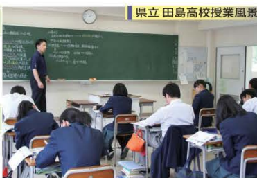
県立 田島高校授業風景