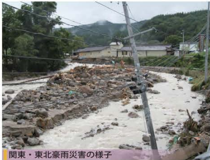
関東・東北豪雨災害の様子

大雨や津波、高潮などにより重大な災害の発生するおそれがある場合、福島地方気象台では、警報や特別警報などを発表して厳重な警戒を呼びかけています。