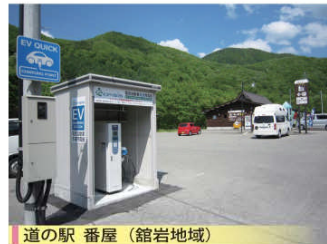
道の駅 番屋 (館岩地域)

東日本大震災以降、日本のエネルギー政策は大きな転換を求められており、再生可能エネルギーへの期待が高まっています。