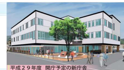
平成29年度 開庁予定の新庁舎