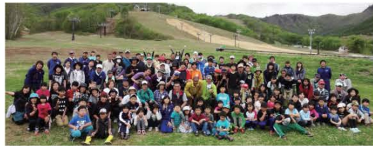
(みんなで記念撮影)

クリーンアップ作戦後は参加者でカレーライスをいただき、お楽しみ抽選会を実施。みんなで楽しい時間を過ごしました。