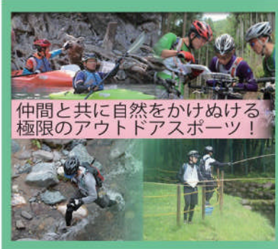
仲間と共に自然を駆けぬける 極限のアウトドアスポーツ!