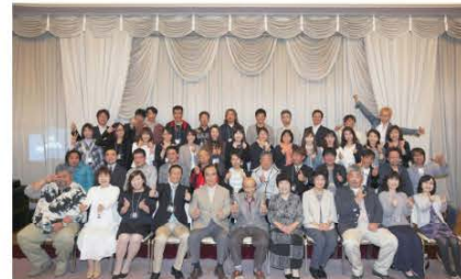
(田島中学校 昭和58年度卒業生「申西会」のみなさん)