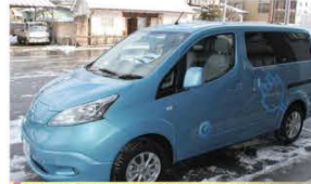
町で活用している電気自動車