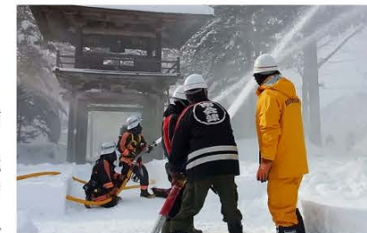
(伊南地域の古町「照国寺」で放水訓練する消防団員たち)

町の大切な財産である文化財を火災から守るため、日ごろから防火への意識を持つとともにご協力をお願いします。