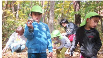
自分たちで育てたヒラタケを収穫する子どもたち

館岩地区林業振興協議会では" 林業振興は人材育成から " という考え方を基本とし、今後も継続して森林環境学習を行っていきます。