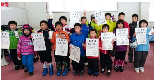
(元気いっぱい滑った子どもたち)

当日はキッズから50歳以上の部まで合計91人が選手としてエントリー。子どもから大人まで一生懸命滑りきり、日ごろの練習の成果を競い合いました。