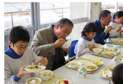
(招待者の方々とおいしく食事する児童たち)

献立は6年生たちが考えたもので、地元および県内産の野菜やきのこなどを給食用においしく調理したものです。会食後は児童から感謝状を贈呈したり、懇談するなどみんなで楽しい時間を過ごしました。