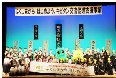
(絆を深め合う糸島二丈絆太鼓と田島太鼓 龍巳会のみなさん)

なお、田島太鼓 龍巳会は「南会津町絆親善大使」に任命されており、今後も福島県と南会津町の魅力を県外へ発信していきます。