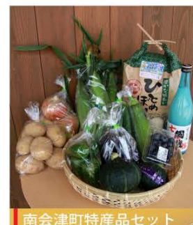
南会津町特産品セット