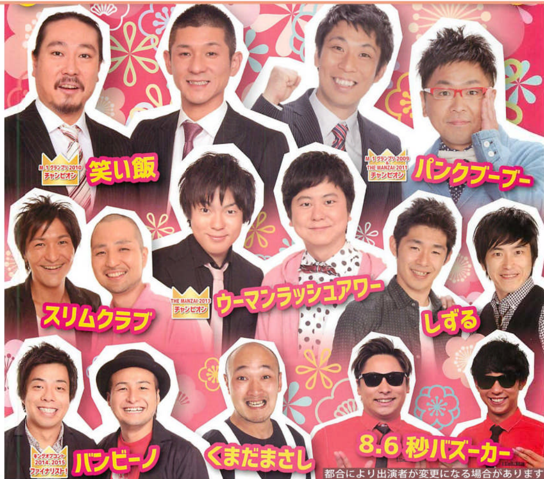
都合により出演者が変更になる場合があります

日時：4月13日(水) 場所：御蔵入交流館 文化ホール 料金：3,500円(前売) 4,000円(当日) 【開場】午後6時 【開演】午後6時30分