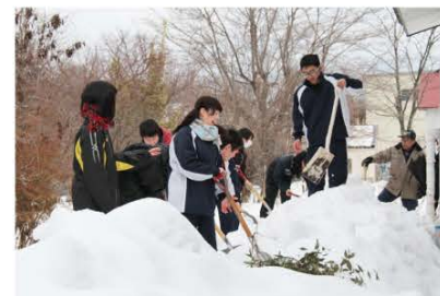
(地域貢献として雪かきを行う田島高校2年生たち)