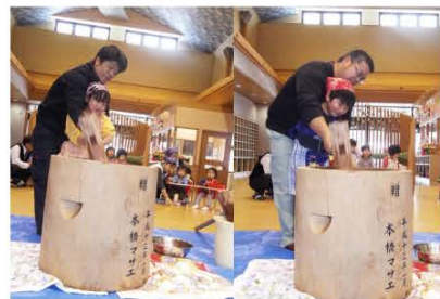
(力いっぱい餅をつくお父さんとその子どもたち)