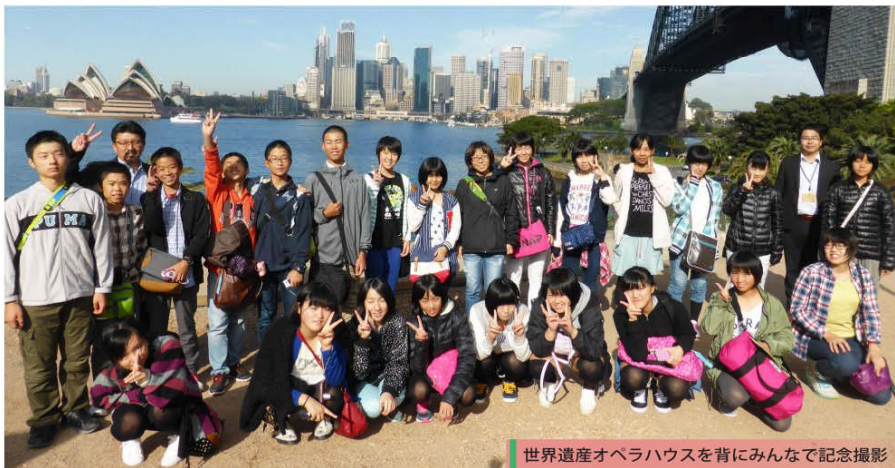
世界遺産オペラハウスを背にみんなで記念撮影

この事業は、21世紀を担う中学生を海外へ派遣し、現地の人々との交流を通して、豊かな国際感覚と日本人としての自覚や責任感を身に付け、国際社会に貢献できる人材育成を目的に2年前から行っています。