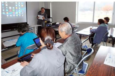
(タブレット講座を受ける参加者の皆さん)

講座は、タブレット端末の電源の入れ方から始まり、最終的には、タブレット端末を利用した地図の参照や動画検索等さまざまな使い方を体験。受講者からは「もっと教えてほしい」などの声が聞かれ、大変有意義な時間となりました。