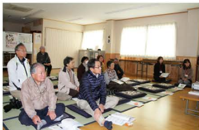
(認知症サポーター養成用DVDを観賞する参加者たち)

当日は、11人が参加。講師の方々は「認知症」の基礎知識や接し方等を講話やDVDを使いながら丁寧に説明し、参加者は認知症への理解を深めました。