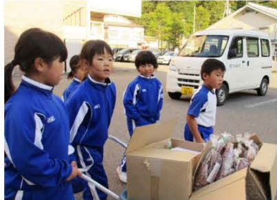
自分たちで栽培したさつまいもを収穫して販売に向かう子どもたち

町では、この活動を通して子どもたちが心豊かで健やかに育まれる環境づくりを推進するとともに、大人同士の結びつきも深まることで、地域社会が一体となって子どもたちの成長を見守る体制づくりにつなげていきます。