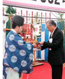
安全祈願を行う大宅町長

新中山トンネルは、県が市町村合併支援道路整備事業の一環として、平成22年度に着工しました。