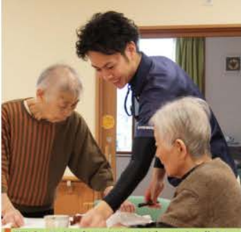
現在の仕事に"やりがい"を感じると話してくれました。

「ずっとこの町で過ごしてきたこともあり、町に対する思い入れは強いです。 町での生活が当たり前になってしまおうと町が持っている自然の良さなどがわからないままになってしまおうと思うんです。 私も進学のために町を離れた時、初めてそのことに気付きました。」と話してくれました。さらに定住を決めた理由を尋ねたところ、 「家族はもちろん、自分を育ててくれた地域に貢献したいという思いから町での定住を決めました。これから仕事や地域の方々など多くの人たちの関わり合いのなかで様々なことを学んで成長していきたいです。」と話してくれました。今後のご活躍に期待しています。