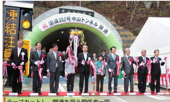
テープカットし、開通を祝う関係者一同

福島県で整備を進めてきた国道352号新中山トンネルが完成し、その開通式が12月1日、滝原地内で行われました。