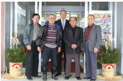
(寄贈された門松と町シルバー人材センターの皆さん)