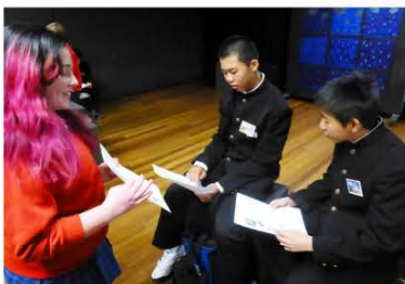
好きな動物になりきって英語で自己紹介する生徒たち