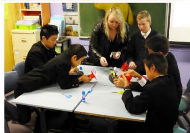
折り紙を使用した語学研修