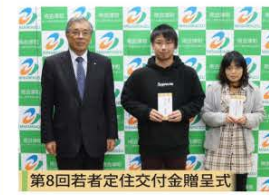
第8回若者定住交付金贈呈式