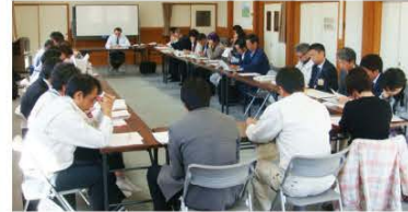
第2回専門部会全体会の様子

町では、人口減少と少子高齢化の進展という大きな課題に対して、少子化と若者の流出を抑制するとともに、移住定住者（U・Iターン者）や交流人口の増加を図ることに主眼を置き、3つの専門部会に分かれて議論を重ね、次の4本の柱を基本目標とする「南会津町まち・ひと・しごと創生総合戦略」を策定することになりました。