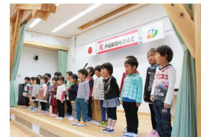
(落成式で歌う子どもたち)

また、地中熱を利用した冷暖房完備となっており、当町の自然を最大限に活用した画期的な施設となっています。