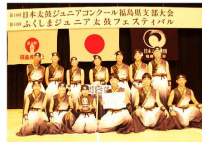
(優勝した田島太鼓龍巳会「白鼓」中学生チーム)