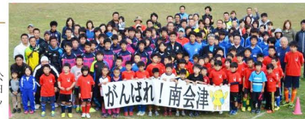
記念撮影の様子（中央が城彰二元サッカー日本代表FW）

当日は、総勢150人が参加、子どもから大人までみんなでサッカーを楽しみました。練習では、必死にボールに食らいつく子どもの姿も見られ、トップ選手と一緒に夢中になってボールを追いかけていました。