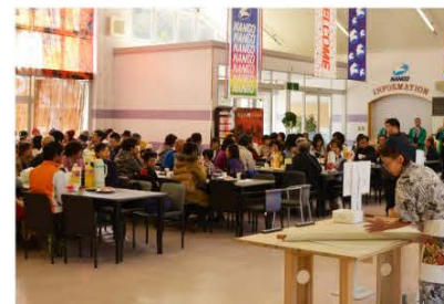
(会場とそば打ち実演の様子)

10月24日、南郷スキー場センターハウス内で第14回南郷新そばまつりが開催されました。 まつりでは、地元の名人達が、そば打ち実演を披露、多くのお客さんが見入っていました。 来場者は、おいしい新そばと新米や地酒などの地元産品が当たる大抽選会など、とても楽しんでいる様子でした。