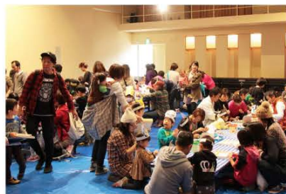
(作ってあそぼうゲームコーナーの様子)

締めくくりに行われた「ぼこぼこつぶのぼのぼの劇場」では、かわいく楽しいコメディに子どもたちのにぎやかな笑い声が会場に響き渡りました。