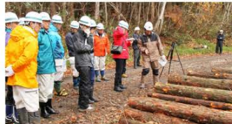
間伐材等の森林資源の有効活用を町では推進していきます。

新規学卒者およびU・Iターン者に生活支援金を交付するとともに、新規学卒者およびU・Iターン者を採用した町内事業所に人材育成費を交付し、町外への若者の流出抑制と町内への若者の定住促進を図っています。