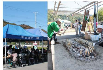
(会場およびあゆを炭火で焼く様子)