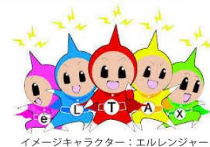
イメージキャラクター: エルレンジャー