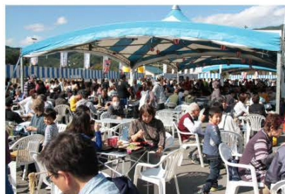
(新そばまつり会場内の様子)

お昼の時間帯には、各店舗で新そばを待つお客さんたちの長蛇の列が見られ、来場者数は約13,000人と昨年度より大幅に増加、大変な盛り上がりを見せていました。