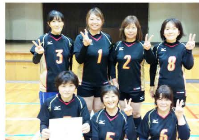
(優勝した川島チーム)