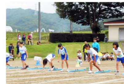
(スタート前の緊張した様子)

当日は、晴天に恵まれ、南会津郡内や泉崎村などから総勢516人が参加し、100m走、走り幅跳びなど14の陸上種目が行われ、大会新記録が17種目と好記録が続出しました。