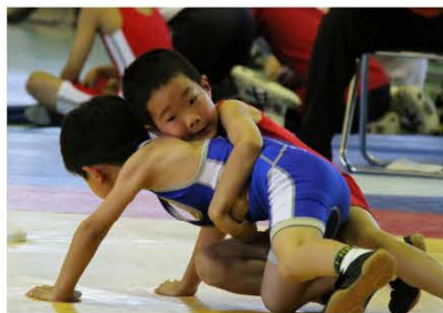
(レスリング大会の様子)