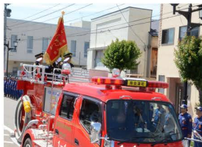
(「民友旗」を掲げた車両行進の様子)

当日は、多くの団員、町民が沿道に参列するなか「民友旗」を掲げた消防車両がお披露目行進しました。