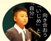
星日々季 (田島小学校6年)

幸い、私の住んでる地域は、内陸なので被害は大きくありませんでした。があの時私は真剣に考えました。今、私たちにできることはなにかと、何かができることが必ずあります。被災者の方がこんなことを言っていました。「自分の代での復興は期待していません。もつとあの世代での復興になるかもしれないが、それでいい。次の世代に繋げるように頑張っていれば必ず復興する。」私はこの言葉を聞いたとき「義民の歴史と同じだ。」と思いました。生まれ育ったふるさとで懸命に生き、仲間と支え合い、力を合わせ次の世代に夢や思いを託す。きつとその時は前に進んでいる実感はないけれども、確実に次の世代に繋がっていく。そのことを信じ、今自分ができることを精一杯頑張ること、そのこと大きな意味を持つことに気付くことができたのです。震災から4年、多くの人たちが受けた悲しみを繰り返さないために私たちが次の世代に確実に語り継いでいかなければなりません。それが次世代を担う私たちにできること