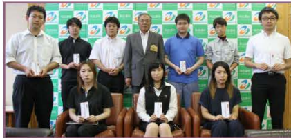
第2回交付金贈呈式は7月16日に行われました。

◆定期的に交付金を贈呈しています この交付金の贈呈式は、定期的に行われています。それぞれのプログラム交付金の対象になるかどうかなどは、商工観光課商工振興係までお問い合わせください。