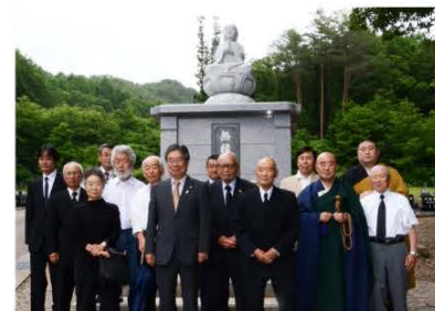
(関係者による記念撮影)

竣工記念式には、関係者約20名が参加、出席者全員で焼香を行い、無縁仏の冥福を祈りました。