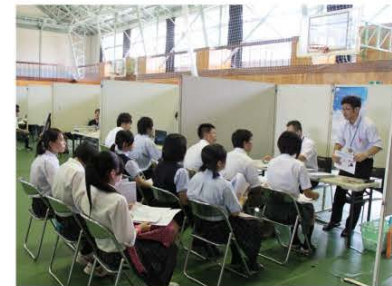
(各ブースに別れて説明を受ける高校生)

7月27日、合同企業説明会が田島高校体育館で開催され、郡内の3つの県立高校や県内の高校から約80人が参加しました。企業側は来春の高卒求人を出している郡内の事業所23社が参加、郡内の雇用情勢は景気回復により多くの働き手が必要としているとのこと。高校生は各企業のブースを訪れ、担当者から会社の概要、仕事内容などの説明を受けました。