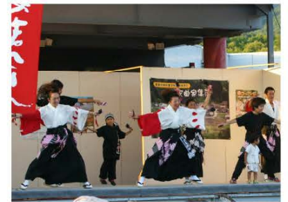
(ステージショーの様子)