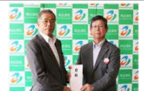
(株) 東北電力 田島営業所より LED 防犯灯 10 個が寄贈されました。