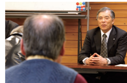
昨年のタウンミーティングの様子。皆さんの声を聞かせてください。

※会場へは十分気をつけてお越しください。 ※事前申込みは必要ありません。上記開催時間までに会場にお越しください。