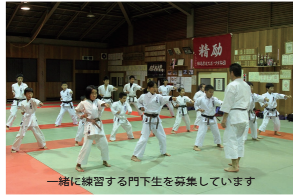
一緒に練習する門下生を募集しています