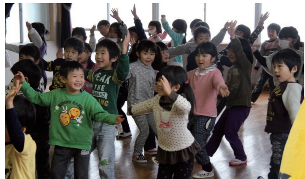
『んだべえ体操』を踊る子どもたち。子どもたちの顔は笑顔で輝いていました。

「んだべえ」の突然の訪問に、子どもたちは大はしゃぎ。「んだべえ」との握手や記念撮影、さらに『んだべえ体操』も一緒に踊るなど、子どもたちは楽しいひとときを過ごしたようです。「んだべえ」は「みんなに会えてうれしかったべえ。あと一緒に体操踊ってくれてありがとう」と感想を語ってくれました。