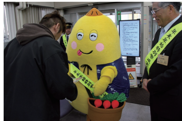
チラシを配布し注意を呼び掛ける「んだべえ」