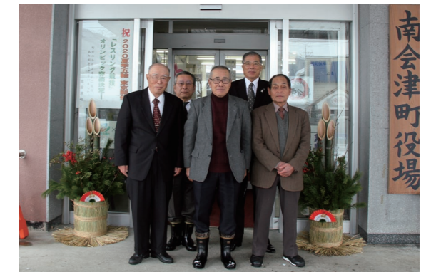
門松を寄贈した町シルバー人材センターの皆さん