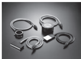
光ファイバー製品