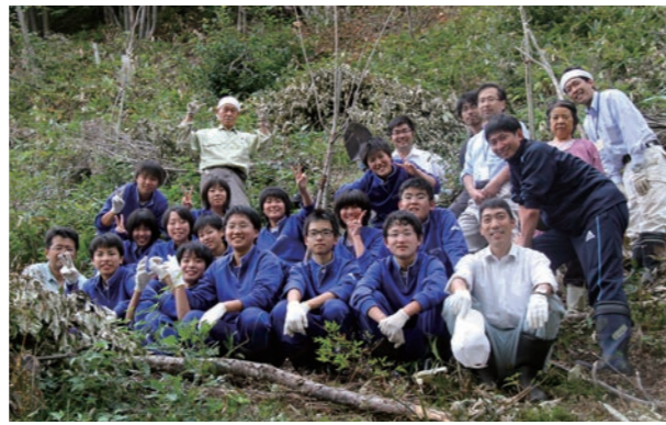
将来、みんなで桜を見に行きましょう。