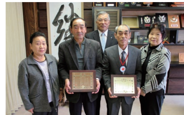
「金色有功章」受章報告に訪れた館岩赤十字奉仕団と伊南赤十字奉仕団の皆さん