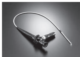
ファイバースコープ