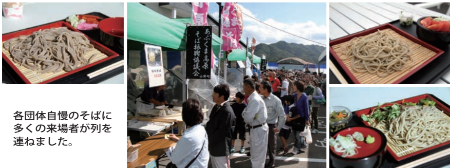
各団体自慢のそばに多くの来場者が列を連ねました。