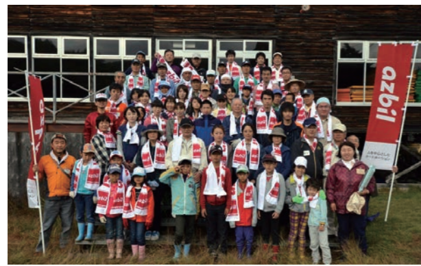
今後もひめさゆりを増やすため、活動を続けていきます。