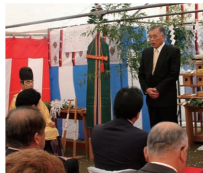
起工式であいさつをする大宅町長

社 会福祉法人桜寿会の特別養護老人ホーム優雅の新築工事起工式が、10月16日、田島字北下原の建設予定地で行われました。町からは、大宅町長をはじめ関係者が出席し、祝詞奏上や地鎮之儀、玉串奉奠などを行い、工事の安全を祈願しました。 来年8月の工事完了を予定している同施設。大宅町長は「町内に大勢いる入所待機者の解消、そして地域の福祉向上のため、地域に親しまれる施設になってほしい」とあいさつをしました。