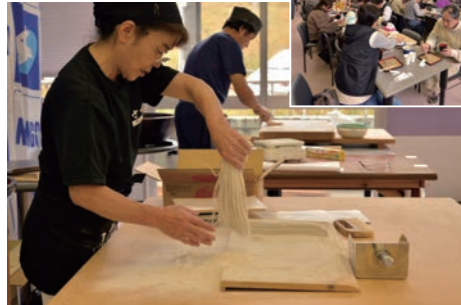
名人のそばを多くの来場者が堪能しました。

地元4人のそば打ち名人による「そば打ち実演」も行われ、名人の鮮やかな手さばきは来場者を魅了していました。来場者は新そばの食べ放題をはじめ、ウドの油炒めなどの郷土料理や南郷トマトなども堪能。さらに地元産品が当たる抽選会などのおもてなしに、心行くまで楽しんでいました。