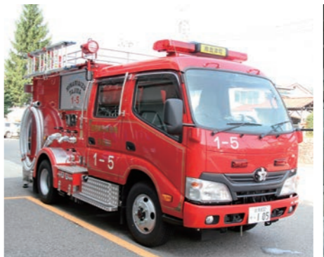
南会津町消防団が所有する消防ポンプ等 (平成25年3月現在)