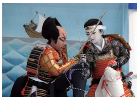
子供歌舞伎の熱演

『田島祇園祭屋台歌舞伎保存会秋公演』や、南会津高校郷土芸能委員会による早乙女踊り、ゆるキャラ「んだべえ」のステージなどが行われ、来場者を楽しませていました。