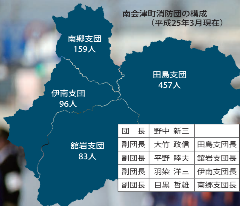
南会津町消防団の構成 (平成25年3月現在)

旧田島町消防団・旧館岩村消防団・旧伊南村消防団・旧南郷村消防団が統合し誕生しました。消防団が抱える全国的な課題として、①団員数の減少②団員の高齢化③サラリーマン団員の増加による昼間の防災力の低下などが挙げられており、南会津町消防団も例外ではありません。団員数は年々減少しており、昼間の防災力の低下が懸念されていました。