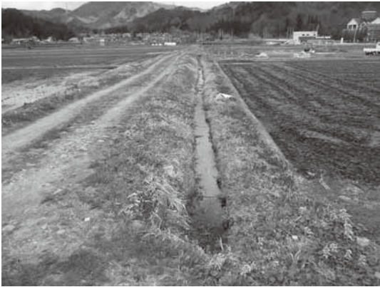
永田字下川原地内の用水路

農地の水路整備が該 次年度以降も継続す る見込みであることか 当するものであり、町ら、今後も地域の要望 内8箇所を整備しま 受けるながら整備を進 めます。