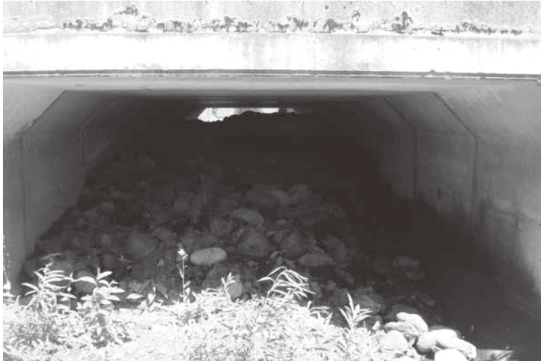
土砂が堆積した暗渠（国道 352 号小立岩地内）