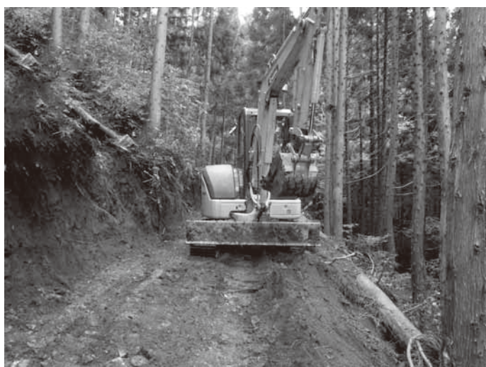
間岸山の路網整備工事（東地内）

国は、交付金を事業者に交付し、賃金格差を是正しています。町でも賃金改善に必要な財源の一部を負担しています。