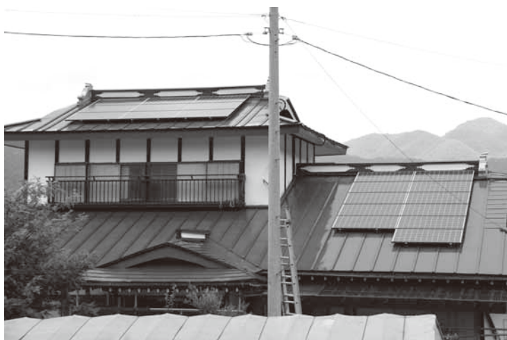
太陽光発電設置住宅