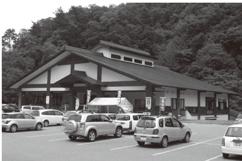
7月1日から指定管理者が変更した「きらら289」

今年度に契 約期間が終 了する施設は、すべて 公募を行なう方針で す。12月議会に管理者 候補者を提案し、来年 4月から2年間を指定 管理期間にしたいと考 えています。