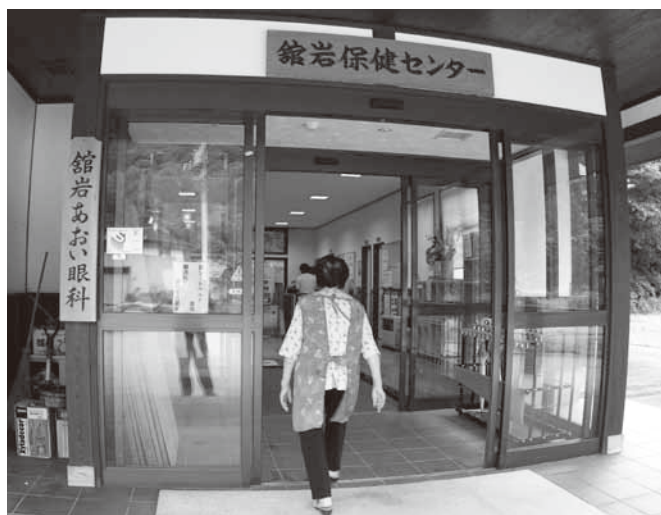
館岩地域のあおい眼科

また、診療が円滑に進むよう、診療所となる保健センターで受けや診察の準備を行い、医師の負担軽減をします。