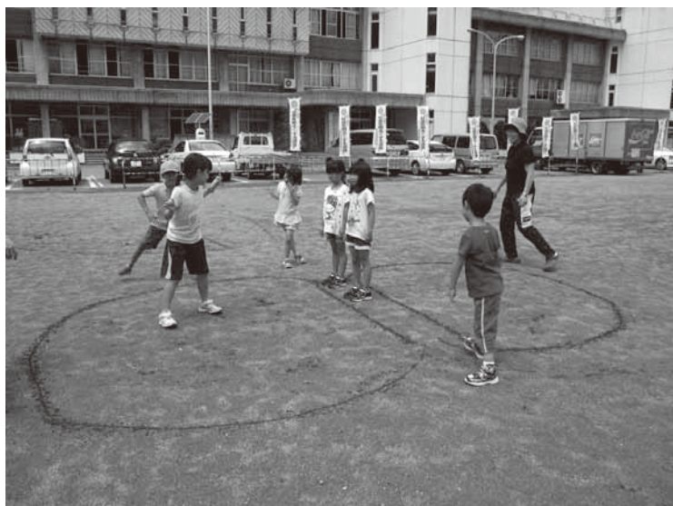
伊南地域学童保育のようす

町長 昨年度実施した希望調査で利用希望者がなかったことから、現在のところ説明会は考えていません。