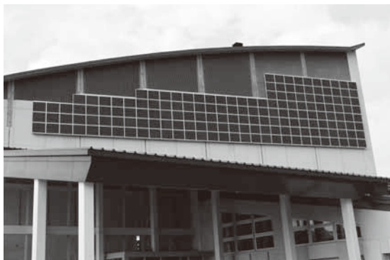
太陽光パネル発電設備（御蔵入交流館）