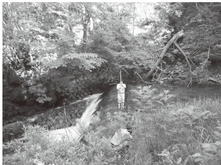
旧針生発電所取水口調査のようす

町長 町と金融機関や民間業者が連携して事業を進めることは有効な施策と考えますが、どれだけの効果とリスクがあるのかなど検証する必要がある、さまざまな情報を得ながら検討していきます。