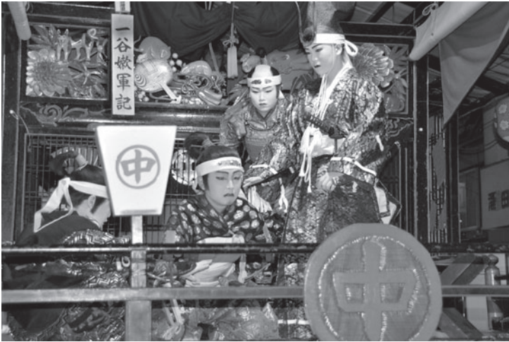
熱演する役者たち（昨年の「時津風日之出の松 嶋山城内の段」）