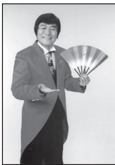
亀 ひろし ～君小路あやまる～