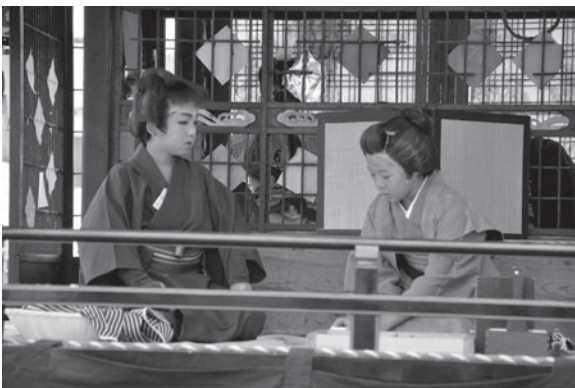
熱演する役者たち（昨年の「南山義民の碑 喜四郎子別れの段」）