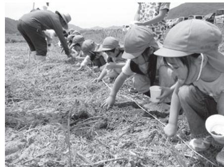
ひまわりの種を植える子どもたち