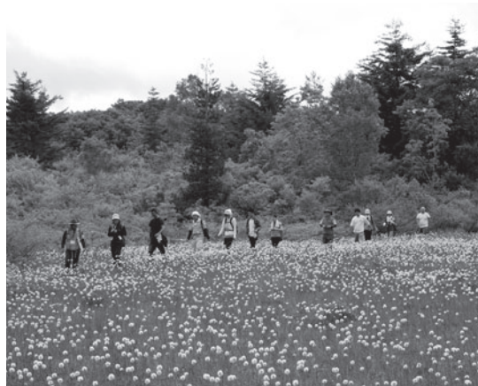
駒止湿原を散策するヤングスクール生

ヤングスクールは、本町の自然と歴史などを学びながら、若者同士の親睦を深める事業です。