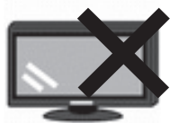
テレビ (ブラウン管・液晶・プラズマ)