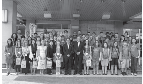
本町を訪れた生徒たちと記念撮影

役場を訪問し、大宅町長から町の概要や風評被害への取り組みなどの講話を聞いた生徒たちは、その後、農業生産法人「伊南の郷」でアスパラガスの収穫を体験したり、南会津高校で生徒たちと交流を図るなど、南会津町の自然と文化を感じていました。