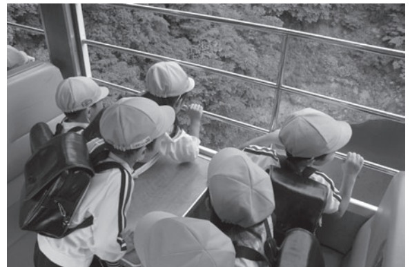
トロッコ車両からの景観に興奮

この試乗会は、会津鉄道利用促進の一環として毎年実施されており、沿線の各市町村の子どもたちを招待しています。