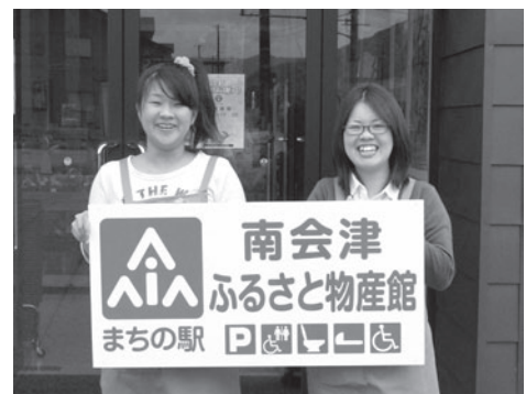
皆様のご来館お待ちしております

「会津田島祇園会館」に続く本町2番目の『まちの駅』となり、観光情報の発信、地場製品の販売など、地域をつなぐ交流拠点としてのさらなる活躍が期待されます。