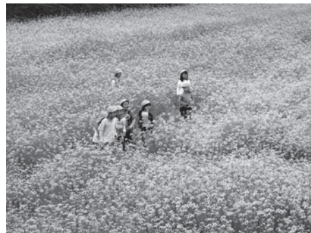
「こっちなかな？」迷路を楽しむ子どもたち

農地は未来の子どもたちへ引き継がなければならない大切な財産です。耕作放棄地の解消については国の補助事業も活用することが出来ます。農地の活用については農林課、農業委員会、各総合支所振興課にご相談ください。