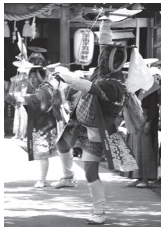
特徴的な衣装を身にまとい大仰な身振りで神輿の出発を触れて歩く『御支度触れ』

神輿が神社前を出発するに先立って、「御支度触れ」が出ます。神輿の出発を町内に触れて歩く役目であるが、格好が特徴的であるため注目されています。その格好は、波に千鳥の裂け羽織、5色の襷がけ、内に女性の反物を着て女帯を前で結び、頭は板冠をのせて端に紙垂を垂れ、紅白の太紐で顎に結わえ、右手に軍配、素足に草鞋履きというものです。神社前、御旅所ごとに大仰な身振りで歌舞伎の六方を踏みながら「御神輿の御立ち、お支度なされましよう」と大声をあげます。