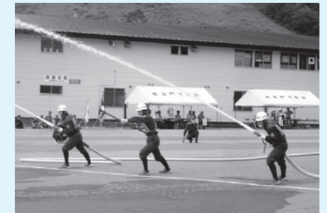
ポンプ車操法の部で優勝した田島支団第1分団第2部

それぞれの種目で優勝した田島支団第1分団第2部(田島第二地区)と田島支団第1分団第7部(水無地区)は、来年開催される予定の消防操法競技南会津地方大会に、南会津町の代表として出場することになります。