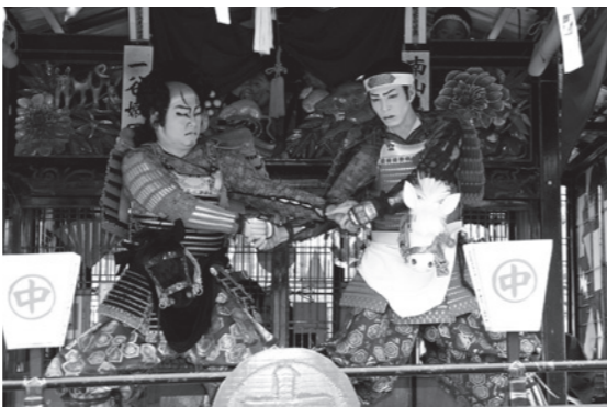
迫力のある演技で観客を魅了した大人歌舞伎

「学制」の制定等により屋台上で子供歌舞伎の上演が禁止され、地元青年会により歌舞伎が演じられて以来、約半世紀ぶりに大人役者による歌舞伎の上演が行われました。もともとは、4つの大屋台それぞれで上演されていた子供歌舞伎が、子ども役者の減少により近年は3つの屋台でしか上演されなくなりました。また、子供歌舞伎指導者育成事業で歌舞伎を学んだ大人を中心に大人歌舞伎の上演案が浮上。メンバーは4月から祇園祭での上演に向け本格的に練習を始めました。子どもたちの指導と自分た