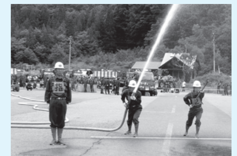
小型ポンプ操法の部で優勝した田島支団第1分団第7部