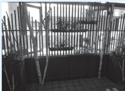
花や白樺などで装飾された会津田島駅

9月30日（金）まで実施していますので、展示施設の近くを通った際にはぜひお立ち寄りいただき、装飾品をご覧ください。花の美しさと木の優しさが、心を和ませ、優しい気持ちにさせてくれます。