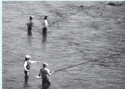
鮎釣り名人の指導を受けながら鮎の友釣りを楽しむ参加者

伊南川鮎産業推進委員会では、このような取り組みを通して鮎釣り人口の増加を目指すとともに、鮎の商品化などに取り組み、鮎による地域活性化を推進していきます。