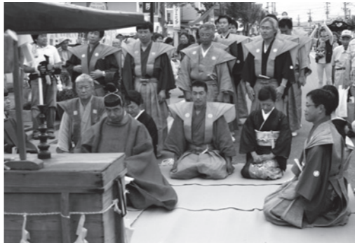
神輿前の神事に臨む田出宇賀神社の3組の御党屋本

田島祇園祭は「御党屋制度」とよばれる、現在10組の当番御党屋組が一年神主の党本の家を支えて祭事を担当する制度によって運営されています。10年目に巡ってくる当番御党屋組を中心に、去年の御党屋組「渡し」と、来年の御党屋組「請取り」の3組が繰り広げる祇園祭は1年がかりの大行事です。