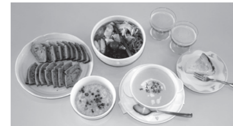
かぼちゃパウダーなどを使ったメニュー

この機会に、皆さんの食卓にも乾燥野菜を取り入れてみてはいかがでしょうか？また、自分のオリジナルパウダーを作って、オリジナルメニューを作ってみませんか？