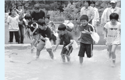
イワナつかみを楽しむ子どもたち

参加者は、イワナつかみや南会津高校生による郷土芸能の早乙女踊り、手打ちそば、南相馬市・南会津町産品販売の出店などのイベントを楽しみました。