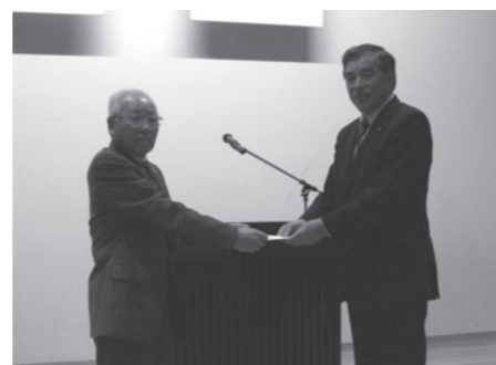
大宅町長に義援金を手渡す室井会長