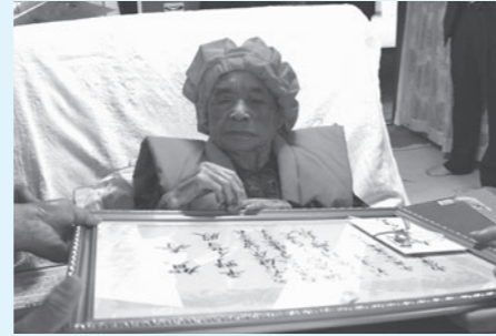
賀寿状を受け取るイセヨさん