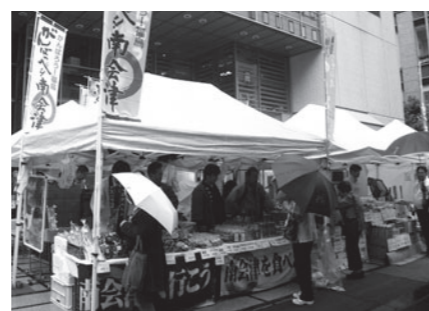
日本橋プラザでのキャンペーン