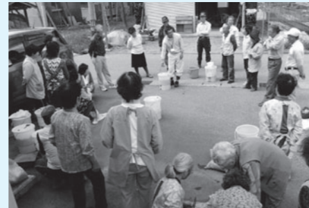
講師の説明を熱心に聞く参加者

今後も6回講習会を開催し、生ごみ堆肥の栄養素やダンボールを使用したぼかし肥料の作り方などを学ぶほか、花壇づくりなどの環境保全交流会を行います。