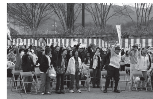
「がんばっぺ!福島」と拳を突き上げる来場者