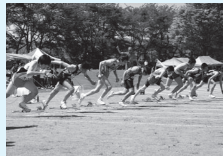
熱戦を繰り広げる選手たち