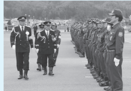
通常点検を受ける消防団員

また、全国消防操法大会で見事優良賞を受賞した田島支団第1分団第6部に対し、福島県消防協会南会津支部長より消防功労表彰が授与されました。