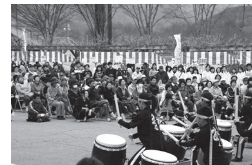
龍巳会の太鼓演奏を楽しむ来場者

来場者は、手打ちそばやしんごろうなどの南会津の味覚を味わったり、田島太鼓クラブ龍巳会や田島中吹奏楽部、田島吹奏楽団の演奏などを楽しみました。