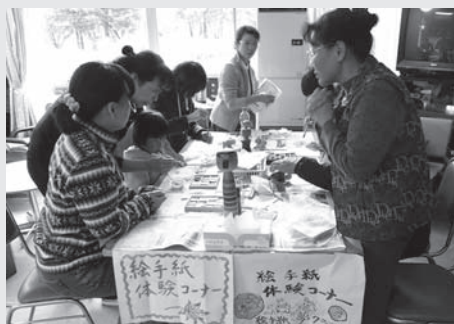
伊南地域文化祭での絵手紙体験の1コマ