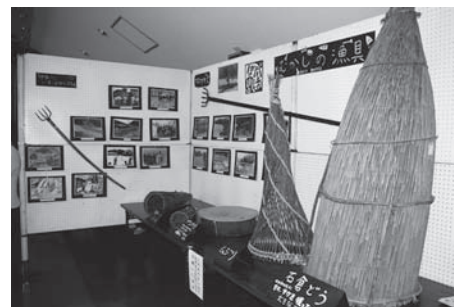
会場に展示された昔の漁具や写真