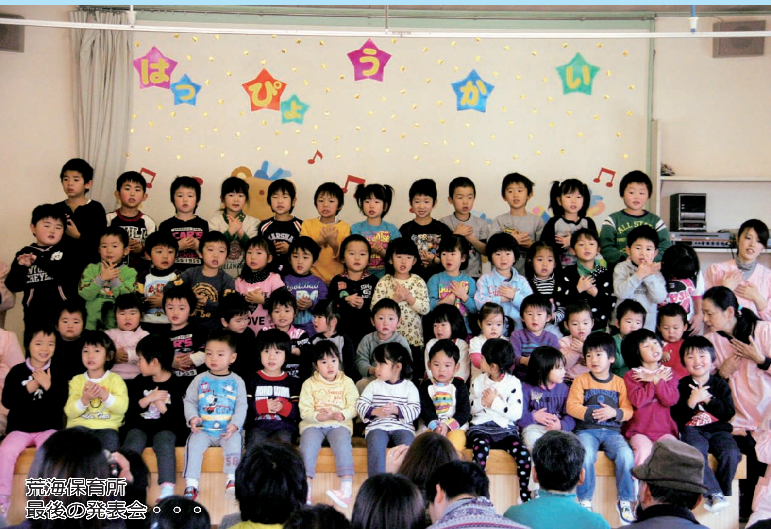
荒海保育所 最後の発表会

4月から統合保育所となるため、荒海保育所としては最後の発表会が、12月9日、同所で行われ、子どもたちが元気いっぱい練習の成果を発表しました。