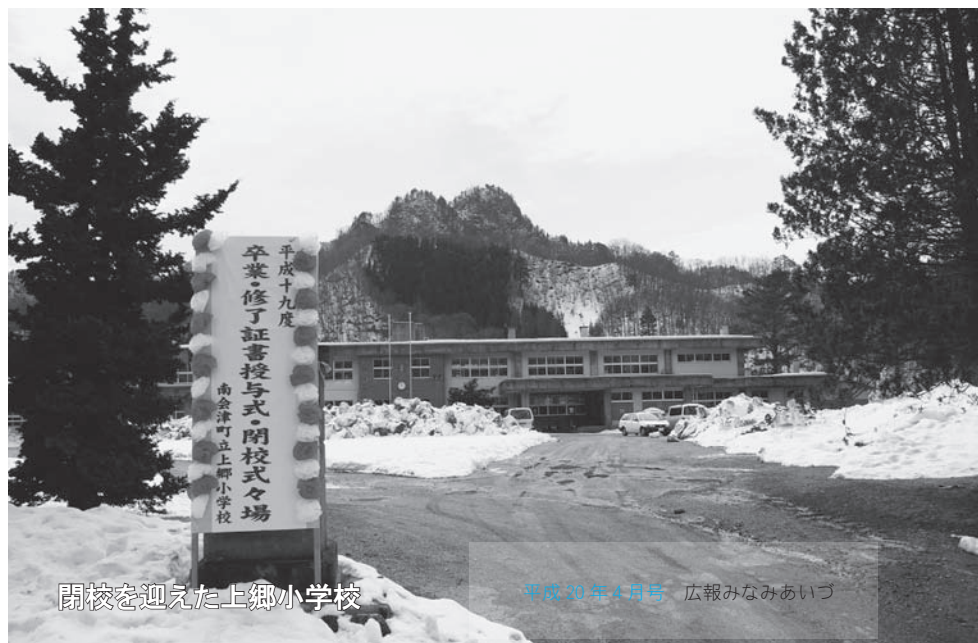
閉校を迎えた上郷小学校