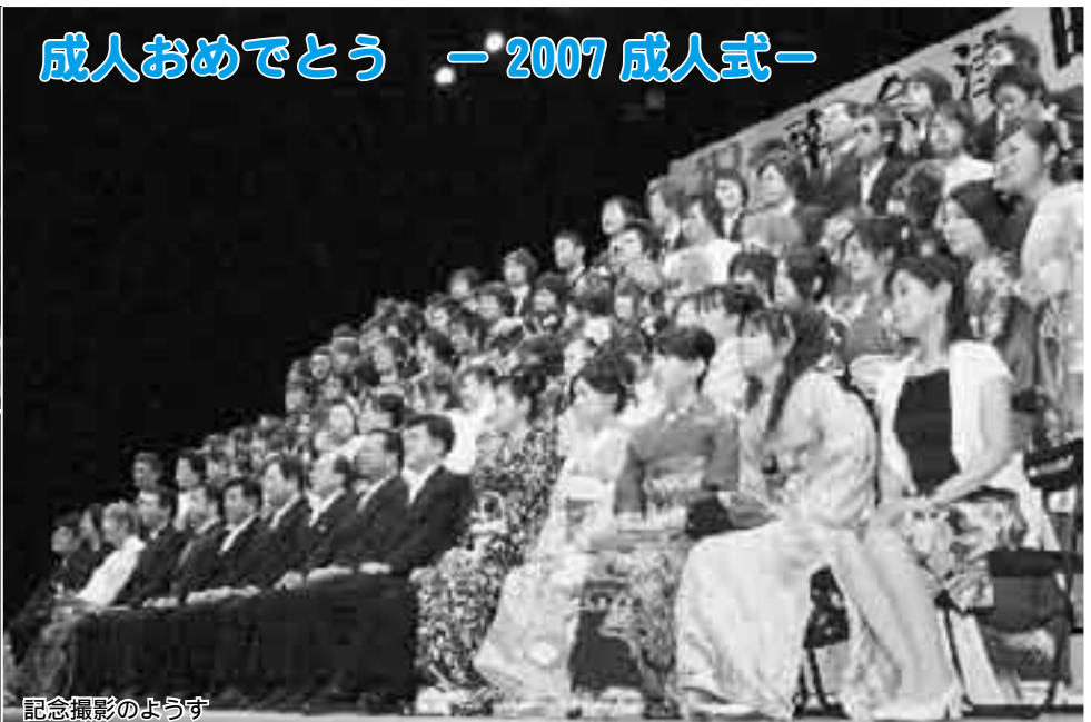
記念撮影のようす