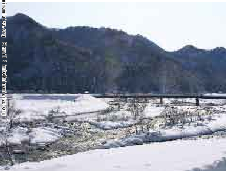
伊南地域宮沢地区から見た伊南川の冬景色